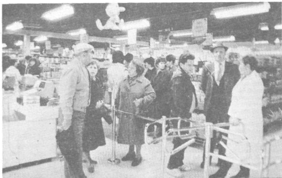
Novi Preskrbovalni center Delikatese ob Cesti na Brdo z živili, je samopostrežna trgovina z živili, gospodinjstvi potrebnimi in delikatesami. Center ima tudi okrepčevalnico. Celoten izredno zanimivo izpeljan objekt ima 1050 kvadratnih metrov. Samo trgovini je namenjeno 460 kvadratnih metrov. Preskrbovalni center je stal z opremo 270 milijonov dinarjev. 90 odstotkov sredstev so dali delavci ABC Pomurka delovna organizacija Delikatesa, 10 odstotkov pa interna banka sozda.