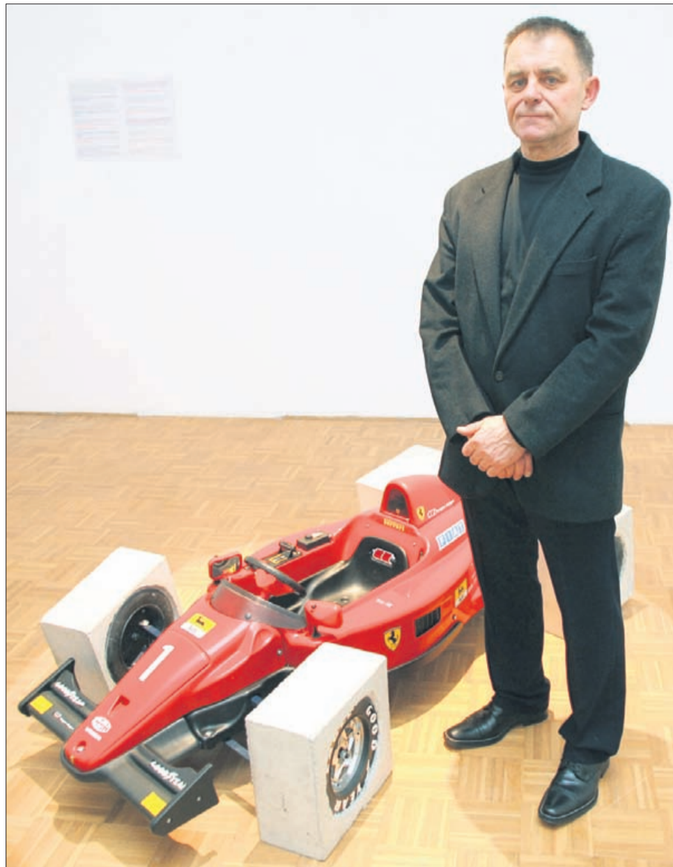
O ferrariju sanja vsak otrok, a ne o takšnem z betonskimi kvadri namesto koles.