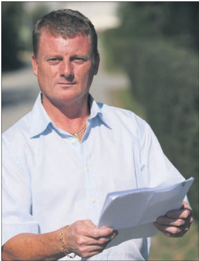
Rado Rojnik je odvetnico prijavil.

Tožilstvo naj bi zoper odvetnico zahtevalo sodno preiskavo