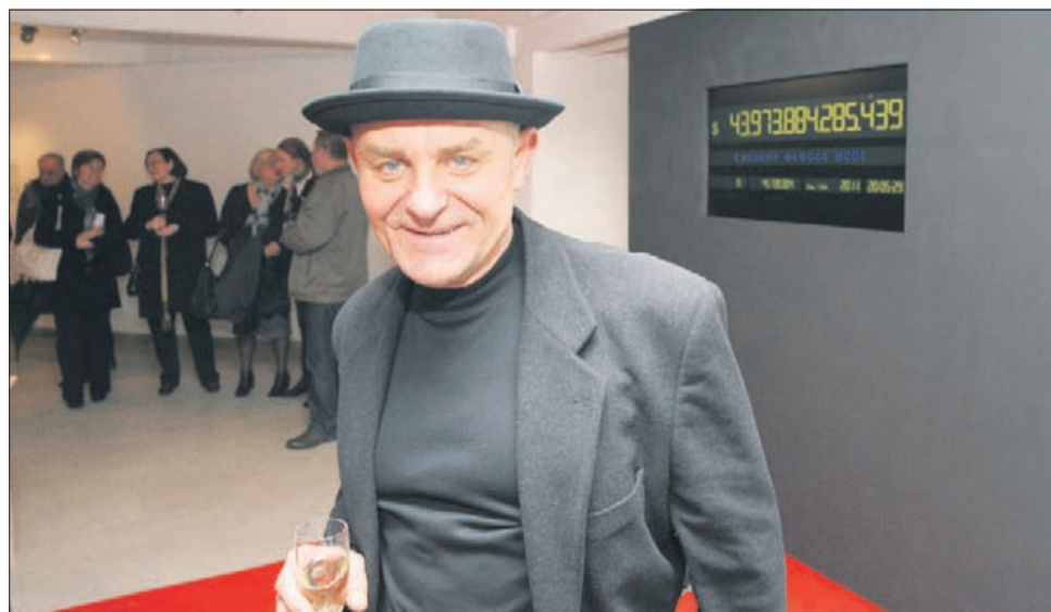
Globalni dolg že skoraj dosega 44 trilijonov dolarjev. Vsaj virtualno, da s tem poveste, kako vam je mar, ga lahko v likovnem salonu zmanjšate.