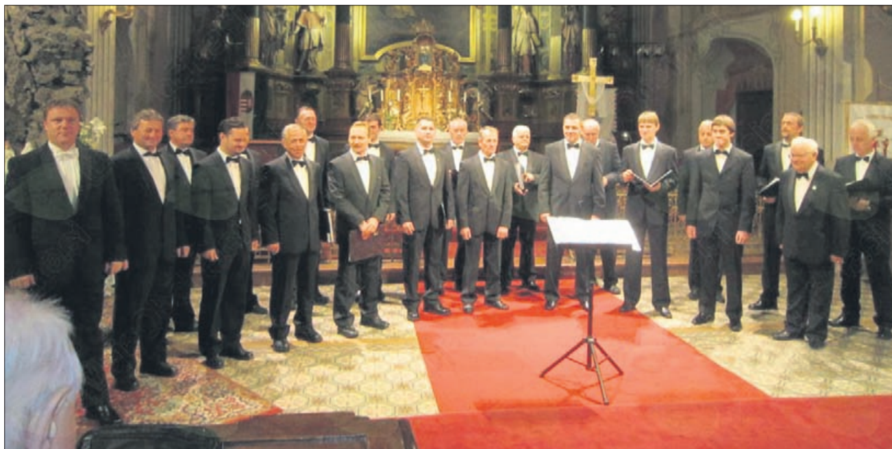
Nastop v cerkvi sv. Mihaela v Budimpešti

dosegel svoj višek na zadnji dan z gala koncertom v baziliki sv. Štefana, prav tako v centru Budimpešte. Vsak zbor je nastopil posamično, sledil pa je nastop več kot 300-članskega združenega pevskega zbora, ki so ga sestavljali vsi udeleženci festivala. Baziliko sv. Štefana je po oceni organizatorjev napolnila 3.000-glava mno-