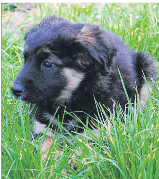
Ajka je stara tri mesece. Našli so jo v Celju. Tudi ona bo srednje rasti.