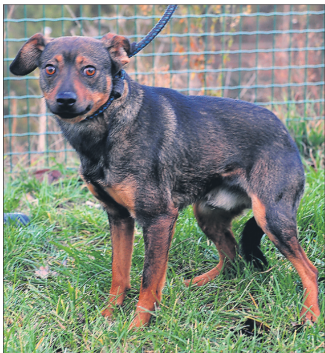
Prijazen Ron je manjše rasti, star 2 leti, našli pa so ga v Zrečah.

»Vedela sem! Uspelo mi je! Toda gospodič Hrček, ni bilo lepo, da sem se takole trudila, zdaj pa ne morem k tebi. Počakaj, te že dobim, ko bo čas za čiščenje tvoje kletke!«