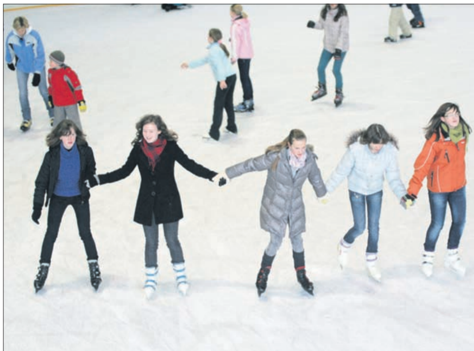
Drsanje ni samo rekreacija, ampak je tudi druženje in zabava.

Kljub temu, da je drsanje preprost šport ga ne smemo podcenjevati. Kakor pri drugih športih tudi tukaj veljajo določena pravila obnašanja, da ne govorimo o previdnosti, ki je še posebno potrebna pri drsanju na naravno-zaledenelih površinah, saj se lahko kaj hitro zgodi, da led kloni pod