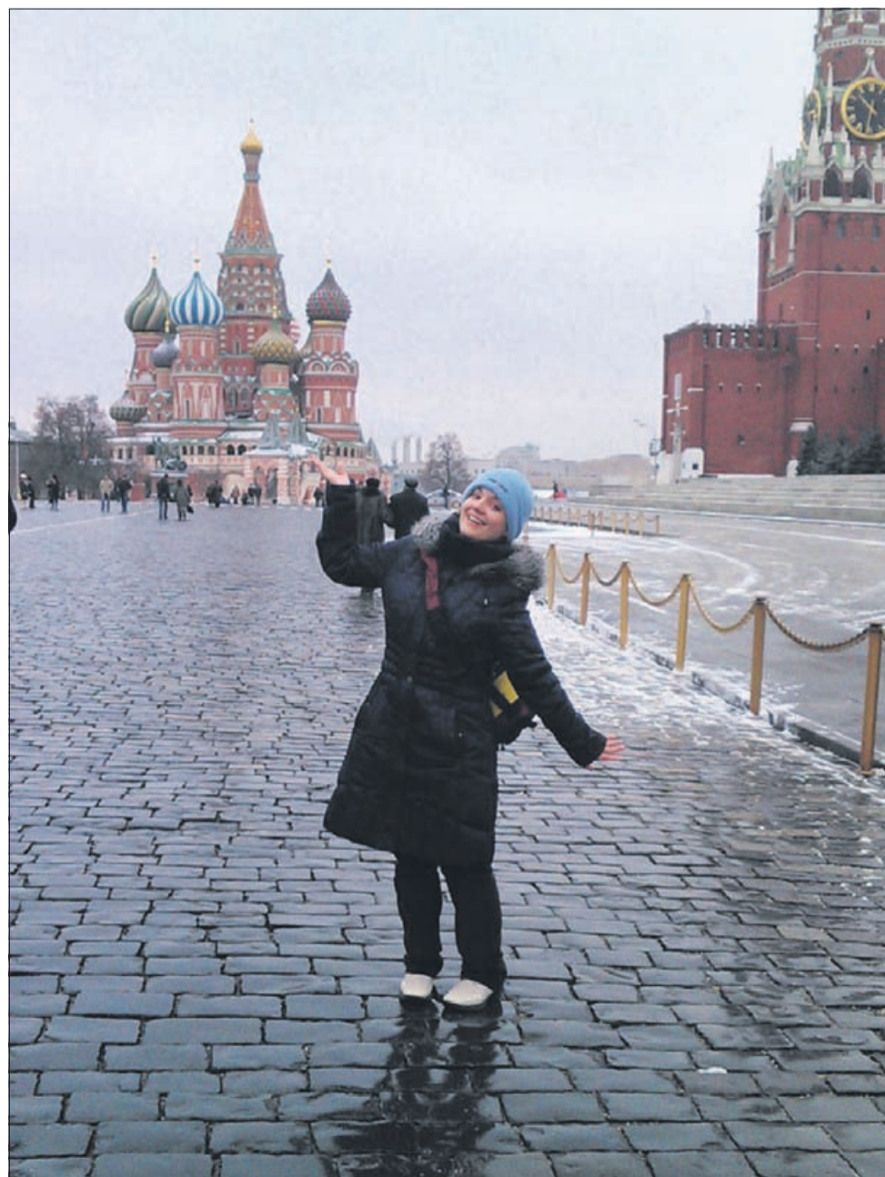
Mlada svetovljanka je s flavto prepotovala že velik del sveta.