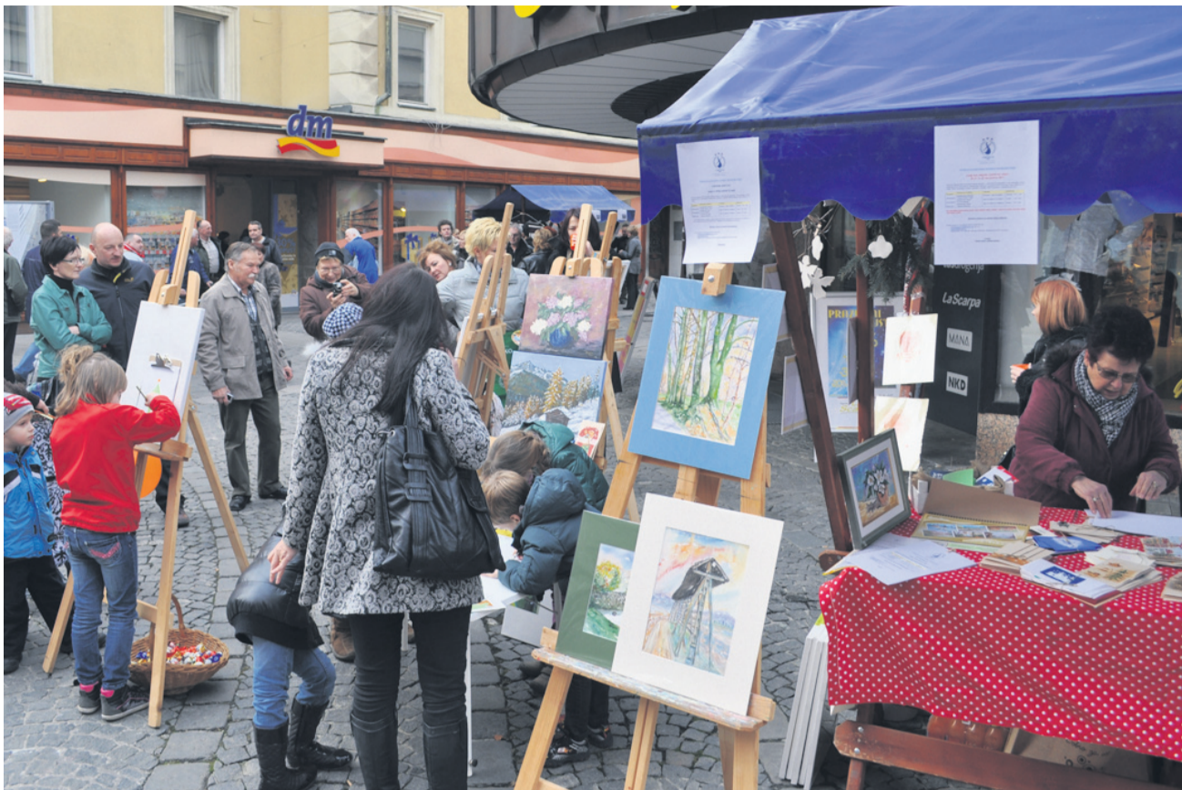
V središču Celja je bilo pred kratkim precej živahno. Za to so poskrbeli v KPD Svoboda Celje, ki so v Pravljični deželi pripravili slikarski tempore Utrinki otroških radosti. Otrokom pa ne bo dolgčas niti med bližnjimi prazniki.