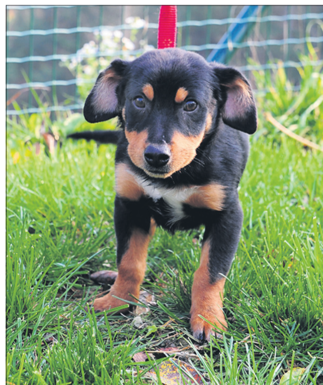
Cene je star štiri mesec. Odvzeli so ga v Slovenskih Konjicah. Bo srednje rasti.