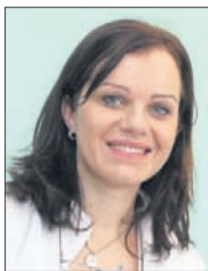
Piše: HELENA PUNGERŠEK, dr. dent. med.

Svetujem vam, da imate ob vsakem obisku pri zobozdravniku zabeležena na listu vsa zdravila in njihove odmerke, ki jih jemljete. Zdravila lahko vplivajo na zmanjšano izločanje slin, krvno sliko, počasnejše celjenje ran. Načeloma velja, da pri konzervativni oskrbi zob (sanacija zobne gnilobe ali kariesa, koreninsko zdravljenje, nekatere protetične