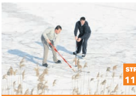
Čas, ko bodo oživila naravna drsališča