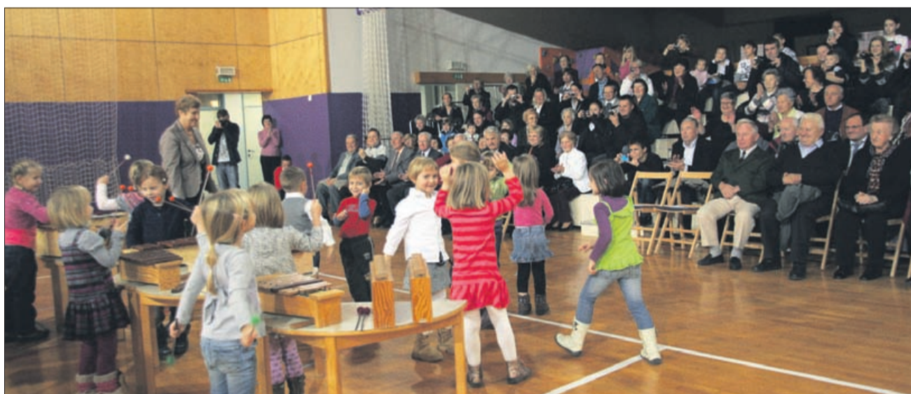
Mlajši so nastopajoči, bolj prisrčen je njihov nastop.