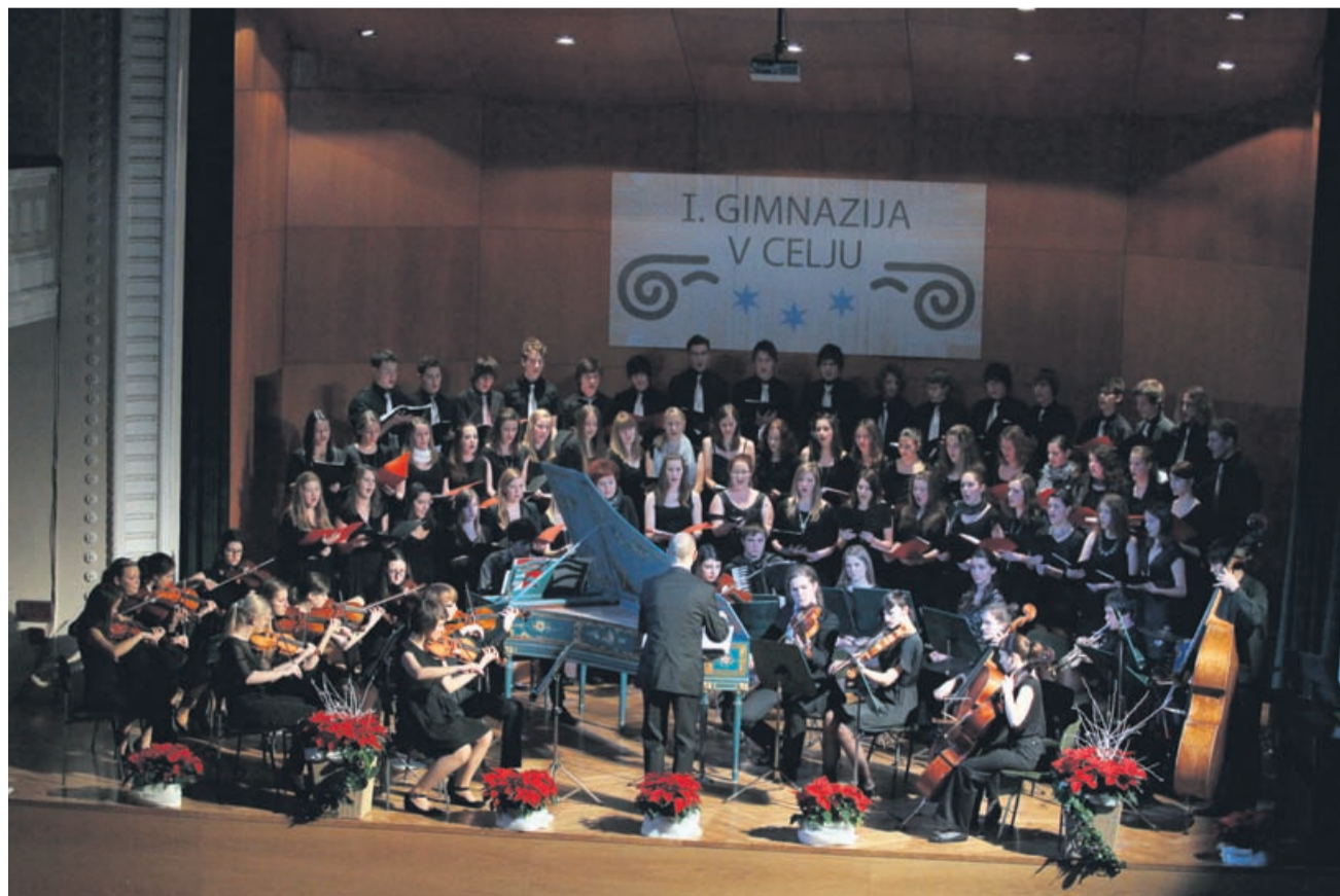
Mladinski mešani pevski zbor in orkester I. gimnazije v Celju sta na tradicionalnem božično-novoletnem koncertu navdušila s klasičnimi, pa tudi s sodobnimi skladbami.