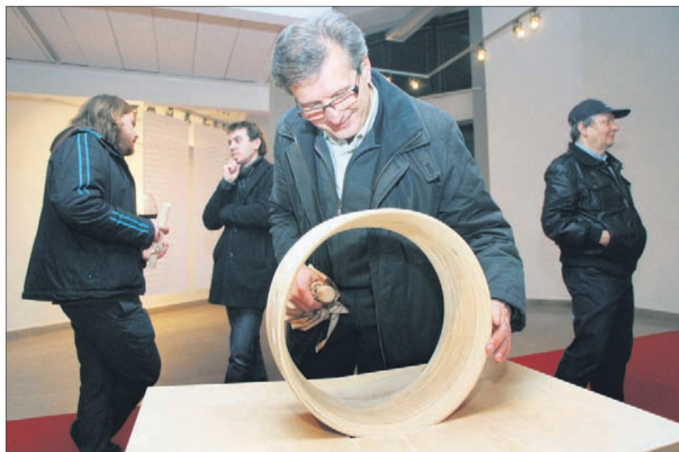
Z vrtenjem lesenega kolesa si lahko med razstavo ustvarite svojo glasbo.