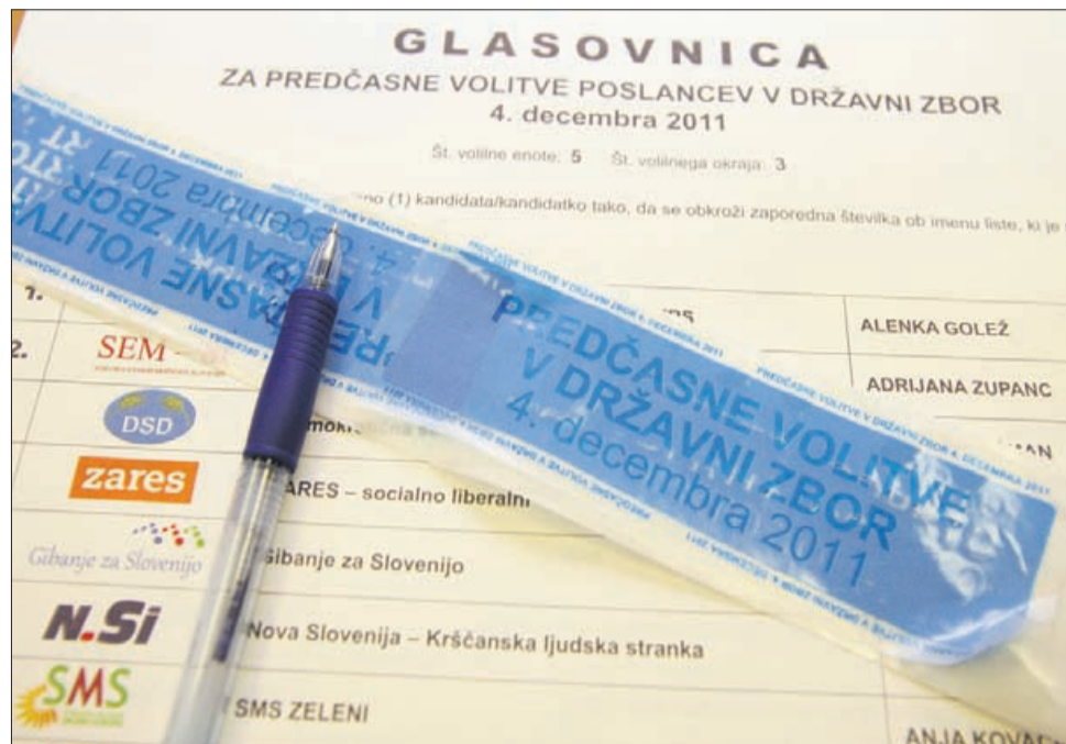
Imena so zdaj znana