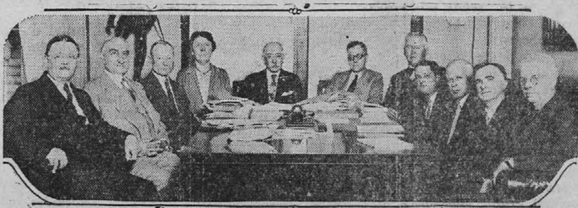
Tu vidite može, ki preiskujejo zločine in prohibicijo v Zedinjenih državah. Komisijo je imenoval Hoover, in komisija naj dožene, kaj je pravzaprav "narobe" v naši Ameriki