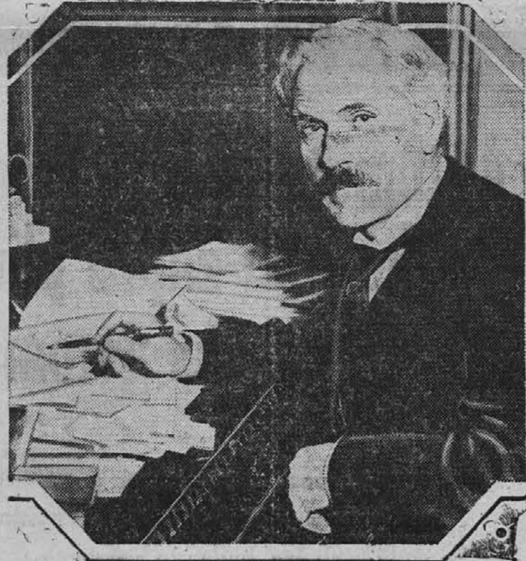
RAMSAY MacDONALD, novo izvoljeni vodja delavske stranke in vlade v Angliji.