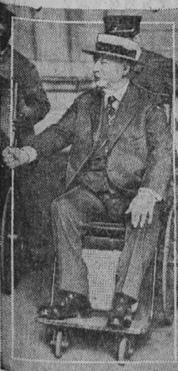
WM. H. TAFT predsednik najvišje sodnije Zed. držav, na oddihu v Kanadi.