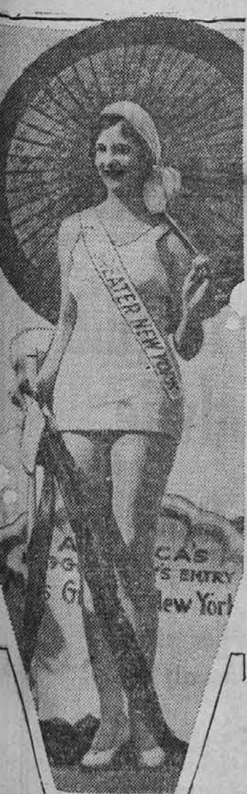
MISS AMERICA ki je dobila v tej sezoni naslov najlepšega dekleta v Zedinjenih državah.