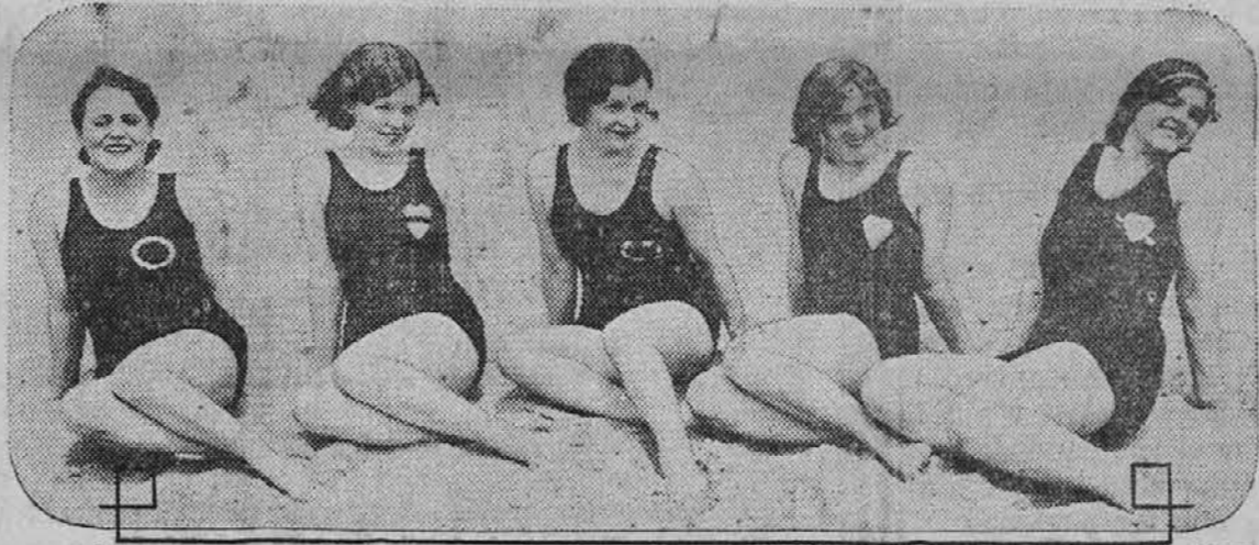
Vi, mladi fantje, ki se hodite kopat v jezero in iščete romantike med kopalnimi lepoticami, se gotovo ne bi zmotili, če bi bila vsa dekleta tako zaznamovana kot so ona zgoraj na sliki. Prva ima na kopalni obleki vшит poročni prstan, kar pomeni, da je poročena. Druga ima počeno srce, ki pomeni, da je zaroko razdrta, tretja ima razbit prstan, torej je razporočena, četrta ima celo srce, tretje je se "ledig in frej", peta pa ima prestreljeno srce, kar pomeni, da je zaljubljen.