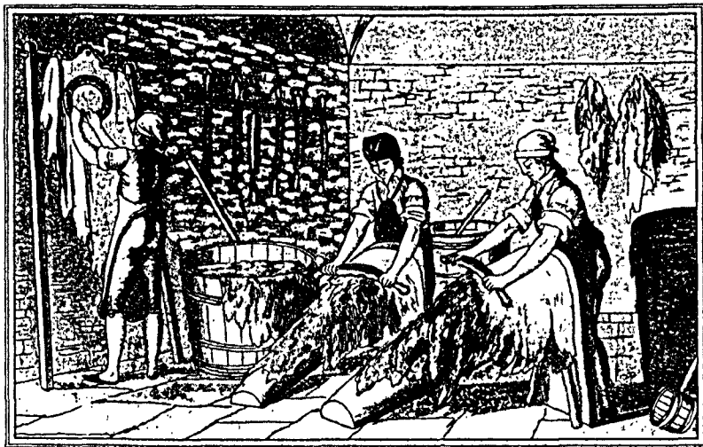
Odstranjevanje dlake in maščobnih delcev