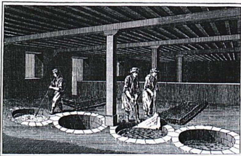
Luženje kož v apnu ali pepelu

Po tem precej ostrem uvodu so svetniki citirali del 15. člena "obrnega reda", ki prepoveduje pomočniku zapustiti delavnico (mojstra), če ni prej izgotovil usnja, ki ga je imel v delu, ali če v ta namen mojstru ni priskrbel zamenjave 13 .