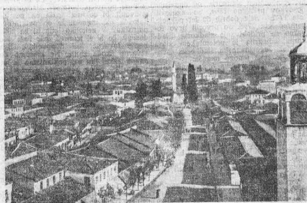
Pogled na glavno mesto Albanije, Tira no, kjer se vršijo svečane priprave za poroko albanskega kralja Zoga z madžarsko grofico Aponnyjevo. —