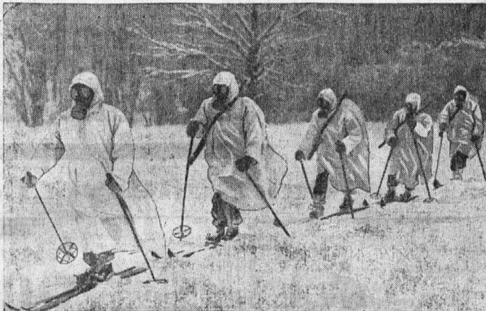
Vojaška smuška patrola v snežnih plaščih in s plinskimi maskami.

V Indiji beležijo vsako leto ogromno število smrtnih žrtev strupenih kač. V Haffkinovem zavodu imajo nad sto velikih strupenih kač, katerim odvzemajo dnevno strup, ki se kristalizira v posebnih posodah. Iz odvzetega strupa — kačo namreč prisilijo, da vgrizne skozi posebno napiet papir v malo steklenico, nakar se ji vlije do petnajst kapljic smrtne tekočine v posodico. Iz tega strupa izdelujejo serum bodisi proti kačjemu vgrizu ali pa proti rauk. En gram strupenega kristala stane v našem denarju okrog 350 din.