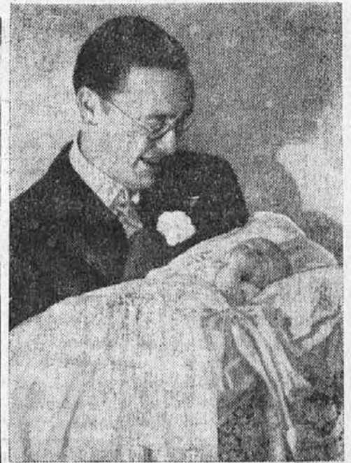
Nizozemski princ Bernhard, soprog prestolonaslednice, kot srečen oče hčerke Beatrice.

»Ti imaš res prav pridno žensko.« »Da, če pridem pozno po noči domov, jo najdem včasih še z metlo v roki pred durmi...«