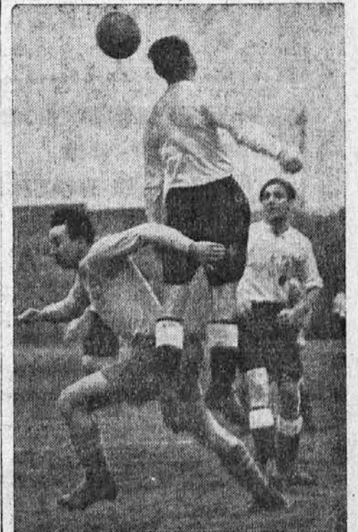
Napet trenutek z mednarodne nogometne tekme Berlin-Praga, v kateri je Praga nepričakovano visoko izgubila 4 : 1.