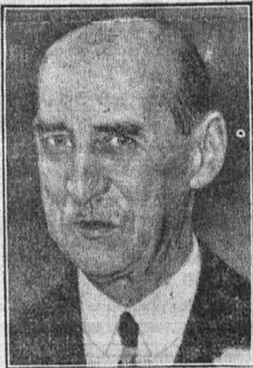
Grški princ Nikolaj II., oče Nj. Vis. kneginje Olge, ki je te dni preminul v Atenah.

Leta in leta so pisarili o propadanju in izumiranju Indijancev. Po avtentičnih ozir. verodostojnih poročilih pa je zadeva povsem drugačna. »Zvezni urad za indijanska vprašanja« v Zedinjenih državah poroča, da število rojstev pri Indijancih močno napreduje, zlasti pri plenumu Navajos v Novi Mehiki. V zadnjih 60 letih je to pleme narastlo od 8000 duš na 45.000. Pri drugih plemenih sicer ni bilo beležiti istega porasta, toda nazadovanja tudi ni bilo. Vzroki naraščanja porodov pri Indijancih so jasni. Moderni Indijanec ne hodi več bolan k svojemur plemenskem čarovniku, nego k pravemu zdravniku. Bolezni, ki so pred 60 in 70 leti redčile vrste Indijancev, so izgubile morilni značaj, tako na pr. tuberkuloza, influenza, ošpice itd. Največji dvig zaznamujejo Indijanci plemena Navajos, ki so se popolnoma prilagodili moderni kulturi in civilizaciji, ne da bi se obenem odrekli svojih plemenskih osobin in materinskega jezika. Moški se v glavnem bavijo z živinorejo, žene s tkalsko umetnostjo. Tudi dejstvo, da so med Indijanci prenehala plemenska nasprotstva, ima svoj dober učinek. Tolikanj osovražena civilizacija je vsaj v tem slučaju razlila svoj blagoslov na uboge Indijance.