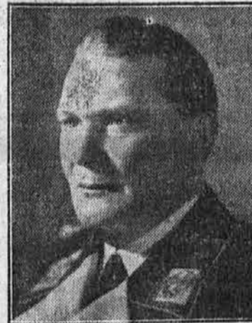
Göring — eden izmed najvplivnejših voditeljev nemškega nacionalnega socializma

»Gospod Piškurnik, v blagajni manjka tisoč din in poleg tega nima razen naju dveh nikdo ključev v svojih rokah.« »Dobro, položiva vsak 500 din nazaj in ne govoriva več o tej zadevi.«