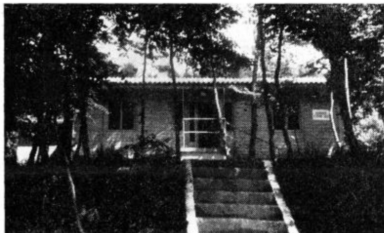
Na fotografiji: Gostišče Črni les je v prijetnem gozdu poleg severne magistrale.

Od 15. junija dalje bo Črni les odprt ob sobotah in nedeljah ves čas (non-stop). Če se bo ta poizkus dobro obnesel, potem bo gostišče odprto non-stop tudi preko tedna.