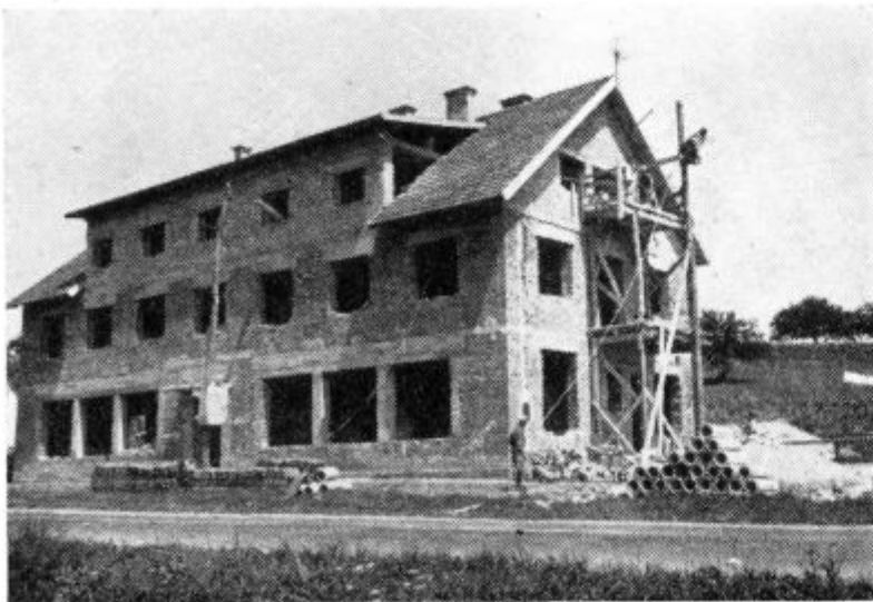
Predstavljamo vam združni dom v Benediktu. Tak je bil lani v tem letnem času. Sedaj je spremenjen v toliko, da so v drugem nadstropju skoraj dograjena stanovanja in spodaj desno pošta

Zavrh postaja vedno bolj priljubljena izletniška točka. V gosteh smo imeli novo ustanovljeno društvo Spačkarjev. Ob sobotah in nedeljah pa je Zavrh vedno številno obiskan. Vabimo vas na Zavrh, kjer boste občudovali lepote Slovenskih gor. Tukaj so zidanice in stare viničarske hišice, ki so se ohranile v prvotni obliki. V Završki kleti pa boste postreženi z domačimi gibanicami, mesom iz tunjske ter dobrimi vini.