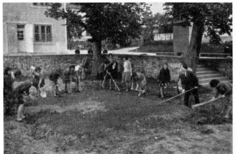
Osmi razred osnovne šole v Voličini je malo pred zaključkom šolskega leta, pod vodstvom upravitelja Franja Škerbinca, uredil okolje spomenika padlim borcem NOB v Voličini.