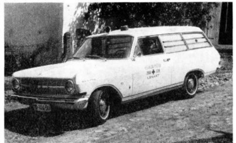
V prejšnji številki smo pisali, da je Zdravstveni dom Lenart nabavil za svojo rešilno postajo nov avtomobil znamke Opel Rekord. Iz našega posnetka je razvidno, da je avtomobil lep in ekonomičen.

Ko bodo v delovnih organizacijah razpravljali o delitvi sredstev, naj določijo tudi del za rekreacijo, so poudarili na zadnjem plenumu občinskega sindikalnega sveta.