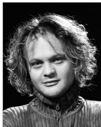
Gašper Jarni, dramski in filmski igralec, lutkar, pevec ter sinhronizator.