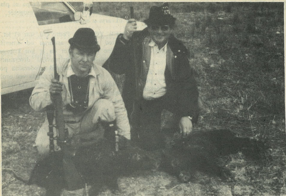
Strahovito nevarne zveri so divji pusk. A našim lovcem koražje ne manjka; kar poglejte fotografijo, saj se jim korajža bere kar v očeh pa tudi steklenica na avtomobilu ni kar za hec.