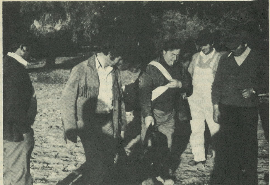
Prav preko "meje" so se podali junaški lovci S.D.M., ter privekli domov (seveda z majhno zamudo) dva divja pujska. (Bi jih še več, pa jim je zmanjkalo municije! — Vprašanje je le katere municije — svinčene ali tekoče?)