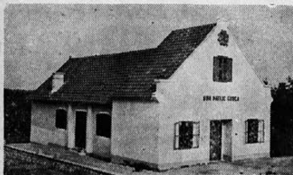
»Dom Matije Gubca« pri Sv. Juriju ob Ščavnici — po dograditvi