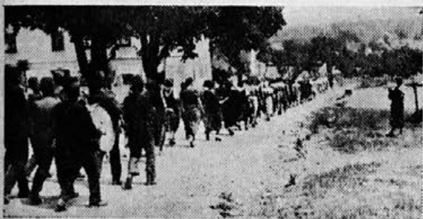
Nepregledna povorka se vrača od polaga- nja venca — za članicami koraka domača godba na pihala