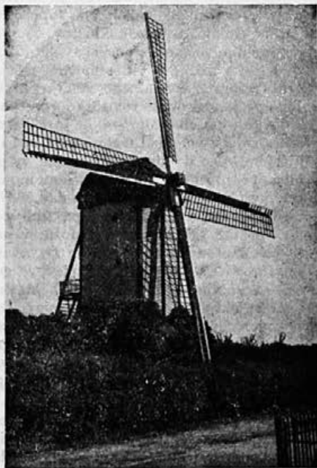
Mlin na veter — najznačilnejši znak severnih dežel

Razmere, v katerih so morali Estonci živeti pod rusko oblastjo, niso bile ugodne. V deželi so gospodovali po mili volji razni ruski plemiči, katerim je bila glavna skrb izkoriščati in tlačiti kmetsko ljudstvo. Kmalu po ruskem porazu na daljnem vzhodu leta 1905., je izbruhnil v Estoniji kmetski