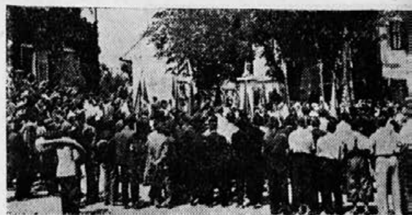
Polaganje žitnega venca pred spomenik kralja Zedinitelja, ki je obkrožen s številnimi zelenimi prapori

Že okrog 8. ure zjutraj začenejajo prihajati kosci, grabljice in konjeniki na železniško postajo v Murski Soboti, da pričakajo goste in da skupno odkorakajo na tekmovališče.