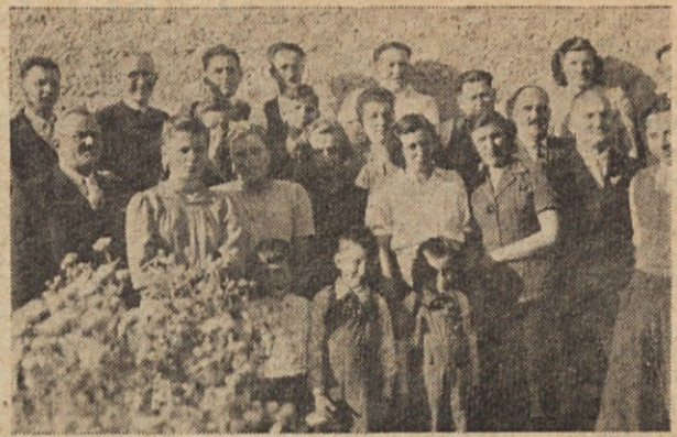
El día de la Confirmación se reunieron las familias de los confirmados Pri Škrbcu v Floridi

Spet smo hiteli dalje. Ko smo prišli v Sunchales, je "sončenje" že znatno popustilo. Saj je bila že pet ura. Stopil sem malo ven, da vidim kak obraz. Spomnil sem se na rojake, ki žive ne prav daleč od tam, toda na drugi progí, katere bi tudi kaj rad obiskal, nanreč Gergoletovi, ki žive v Vignaudu pri Monterosu. Žal vlak ni tako kot je bila cesarska pošta, ki je na željo