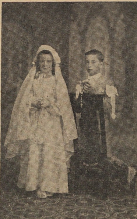
Julio in Nelly Gergolet v Vignaudu na dan Prvega sv. Obhajila.

"Oh, Matijče, pripovedoval bi ti lahko dva meseca, tudi tri, pa še ne bi bil pri