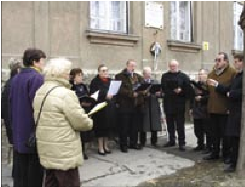
Pevski zbor iz Potrne je zapel pri Pavlovi hiši

V tednu slovenskega kulturnega praznika smo se 10. februarja v Szombathelyu spominjali 60. obletnice smrti Avgusta Pavla. Umril je 2. januarja 1946 v Szombathelyu, kjer je tudi pokopan. Rodil se je l. 1886 na Cankovi, ob avstrijski meji, na Ogrskem. Bil je dijak monoštrske gimnazije