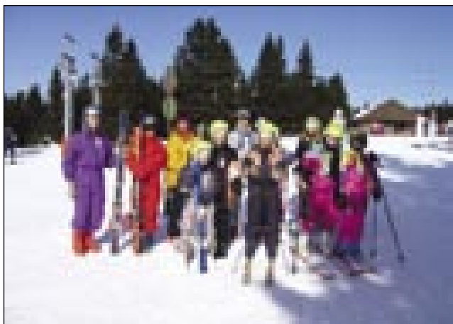
Skupina števanovskih otrok in učiteljev

Zelo sem ponosna, da je naša mala šola lahko zagotovila svojim učencem to možnost. Zato se moramo zahvaliti predvsem našemu ravnatelju. Upam, da bo iz tega nastala