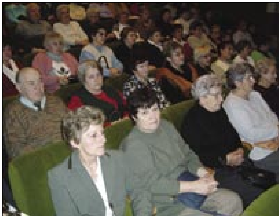
Na svetek slovenske kulture je prišlo kakšni 250 lidi iz Porabja in Prekmurja

Druga rejč v stavki je slovenski slovenska, slovensko . Ka je