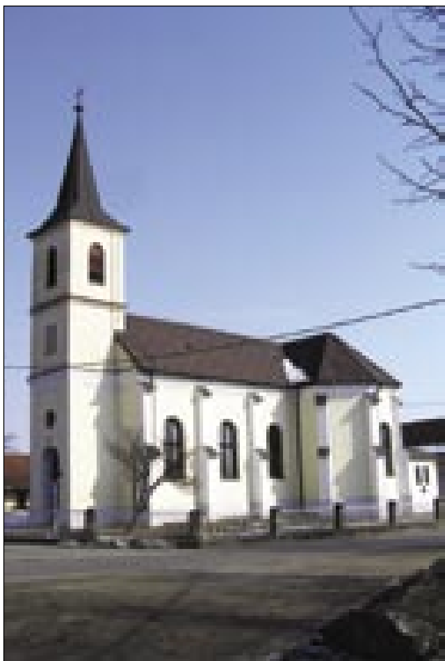
Hotiza, farna cerkev sv. Petra pa Pavla z jugozahodne strani