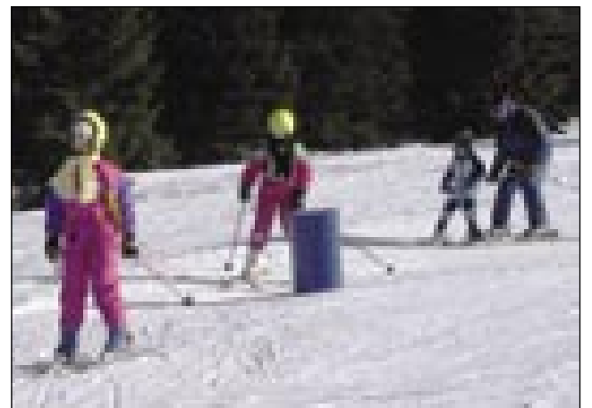
Učenci so bili spretni in zadovoljni

Naslednji dan, v soboto, po zajtrku spet hop! Na smučiču!!! Bili smo ves dan na smučišču. Tudi mi odrasli smo vse bolj uživali v smučanju, a otroci še