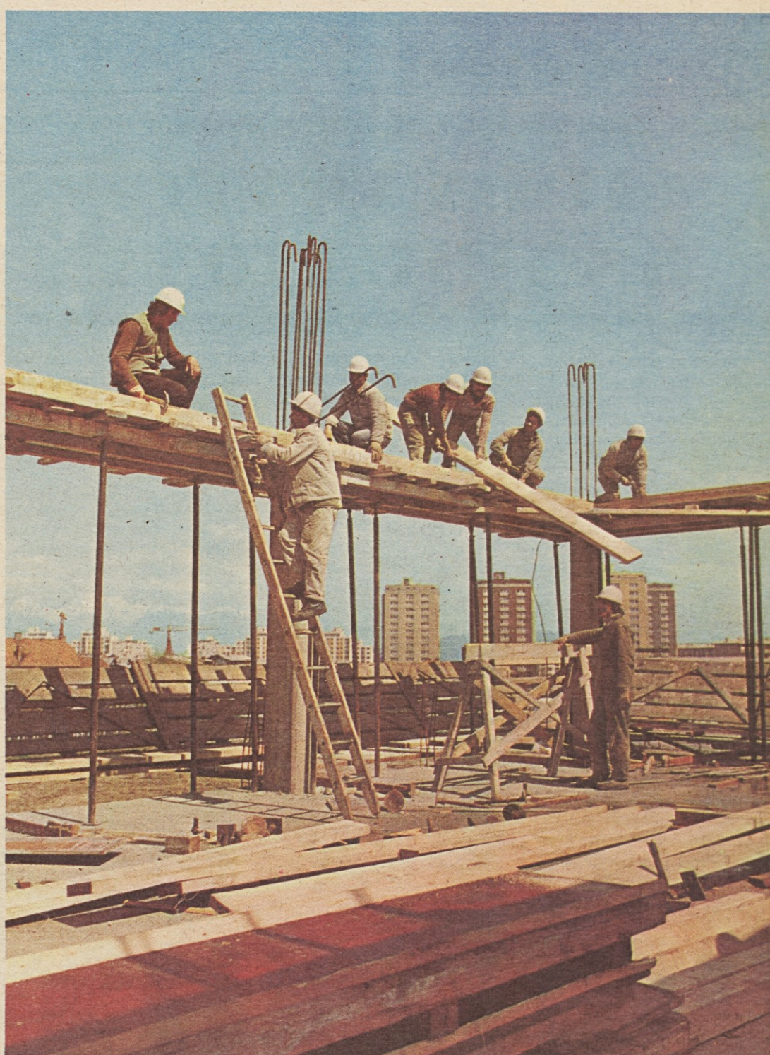
Delavci Gradisa si grade v Ljubljani svoje nove upravne prostore ...

Nova organizacija in razširitev obratov gradbenih polizdelkov v Ljubljani in Mariboru, kakor tudi separacije in betonarne v Mariboru omogočajo razširitev industrijske proizvodnje raznih montažnih elementov za vso Slovenijo.