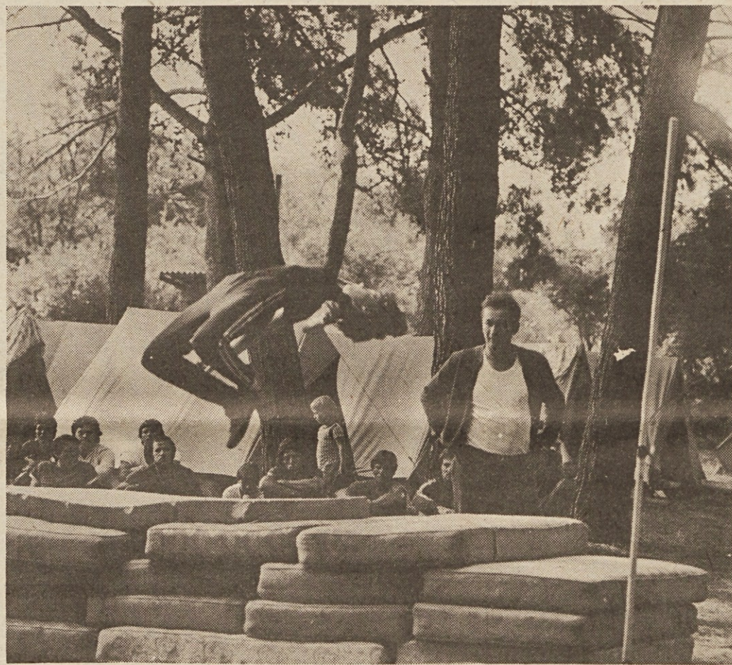
V taboru ljubljanske visoke šole za telesno kulturo v Rovinju so se tudi letos zvrstili številni diplomanti, ki so se seznanili z