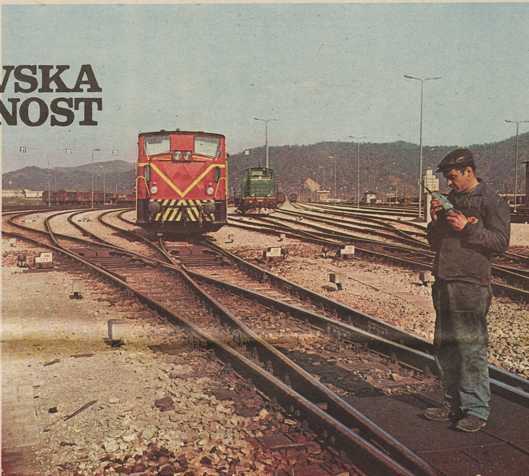
Na ranžirni postaji se rojevajo vlaki...