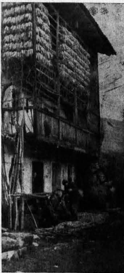
MOTIV IZ FURLANSKE SLOVENIJE

«Tam gor na Rauni na levo roko petelinci mi pravijo, kje jubce spijo. Tam gor na Rauni, kjer uoda teče, kjer je vince an žgace, so ljepe čede... Oh, mati, vi mate ljepe reči, mate no jubco mlado, o, le dajte mi jo! Če je nečjete dat, o, le mejte jo, mat, gor na pečjo jo ložite, gor naj se pečče...»