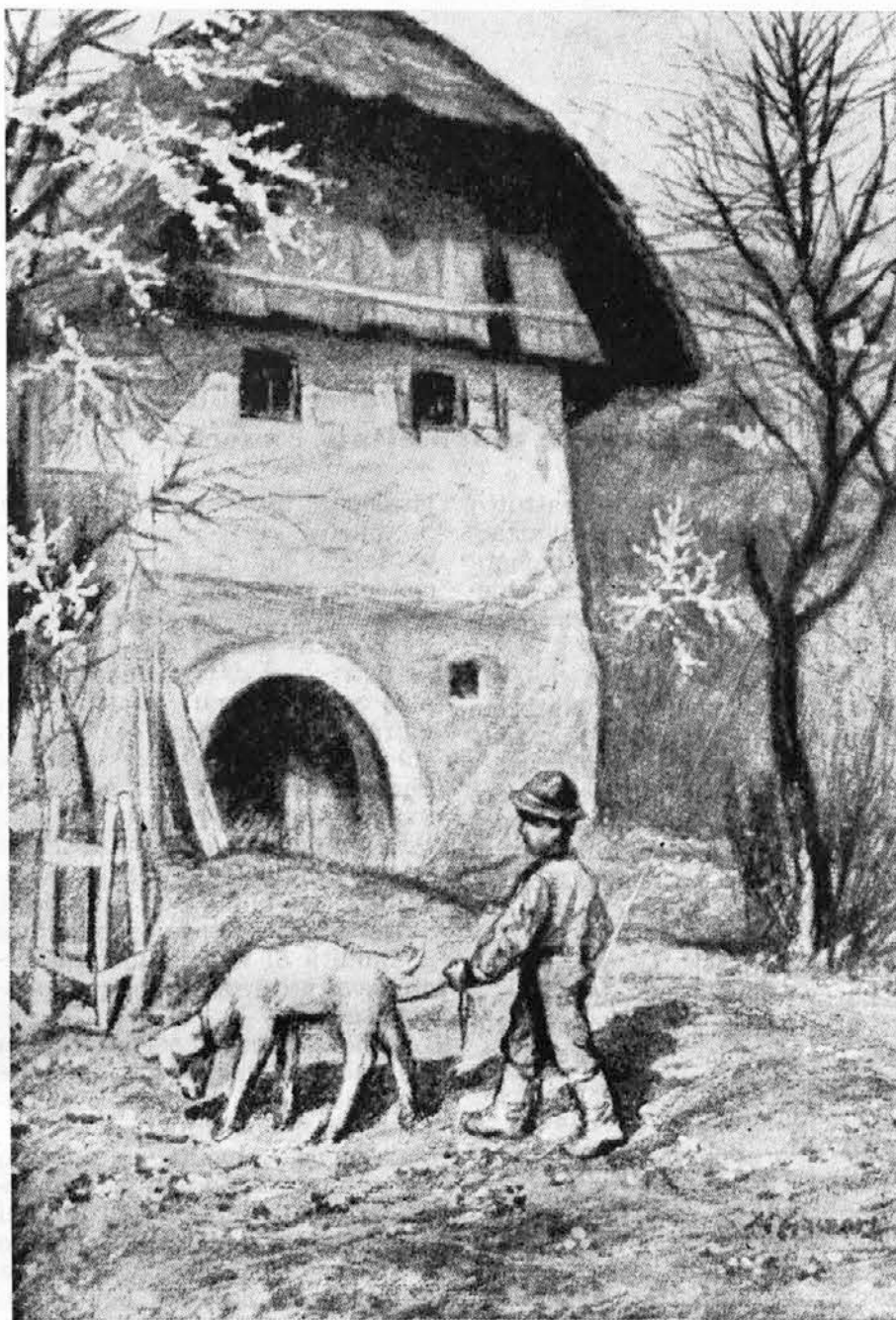
MAKSIM GASPARI: Pomlad na Dolenjskem