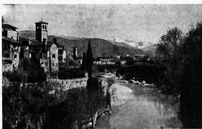
Cividale contempla con occhio malinconico le Convalli del Natisone impegnate in una dura lotta per l'esistenza

Odgovorni urednik: VOJMIR TEDOLDI Dovoljenje videmskega Tribunalja n. 47 Tipografia G. Missio - Udine