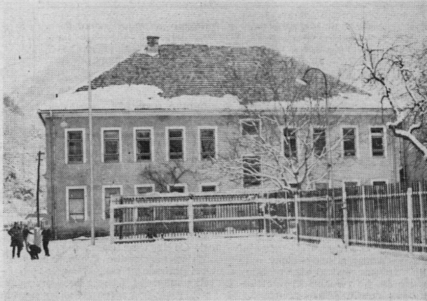
SOLA RADEČE OD LETA 1906 DO 1963