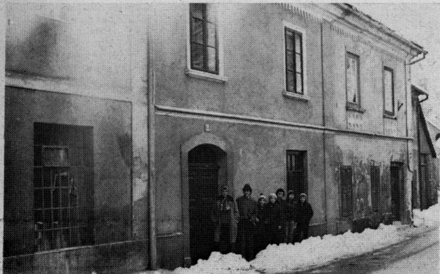
TUKAJ JE IMELA SVOJE PROSTORE RADEŠKA ŠOLA OD LETA 1880 DO 1906

Na šoli poteka pouk v izmenah. Tak način učencev popoldanske izmene ne-le zapostavlja, ker je človekova ustvarjalnost dopoldne večja, pač pa onemogoča še druge stvari: ne daje jim možnosti za kabinetni pouk, zavira vsako dopolnilno in dodatno delo z učenci, otežkoča delo v