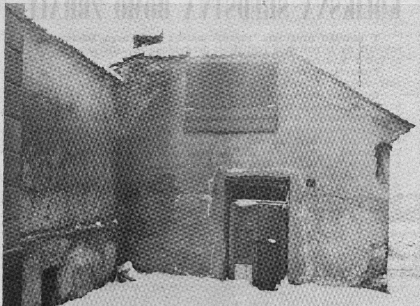
V TEJ STAVBI, KI JO JE ZOB ČASA ZE MOČNO NAČEL, JE BILA ŠOLA RADEČE NEKAKO DO LETA 1880

samoupravni faktor, saj učenci sami upravljajo s temi dejavnostmi. Vse to pa zahteva tudi ustrezne prostore, zahteva čas. Pri nas je ta dejavnost otežkočena in postaja iz dneva v dan