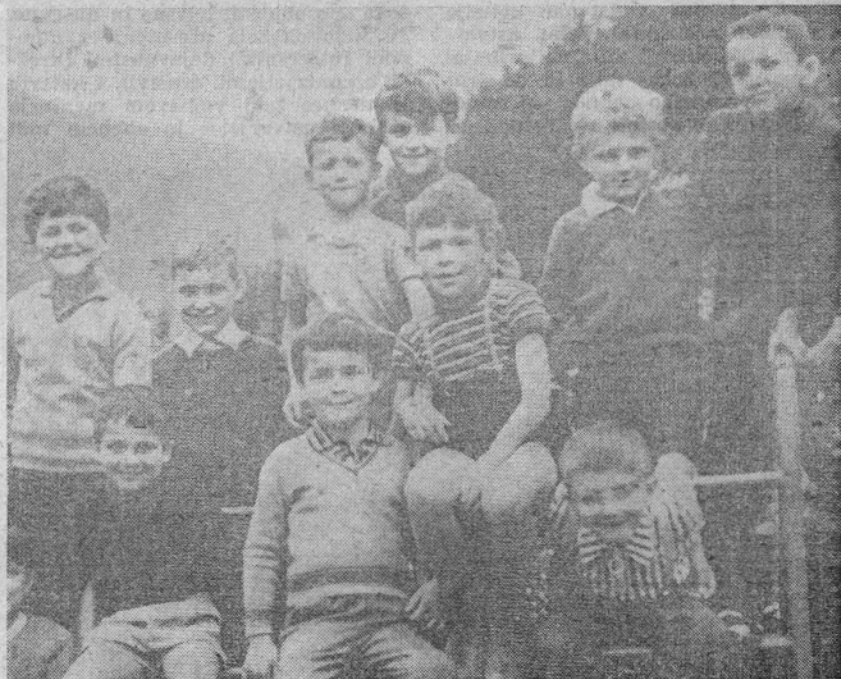
BOSTE 19. XII. ODDALI SVOJ GLAS ZA NAS, ZA NAS, KI SMO VSI VAŠI?

Kot vedno se je tudi v tem primeru izkazal interes in dolžnost lastnega angažiranja pri reševanju krajevnih vprašanj. Tako se je ob upoštevanju zavesti in interesa občanov rodil dobro pripravljen akcijski pro-