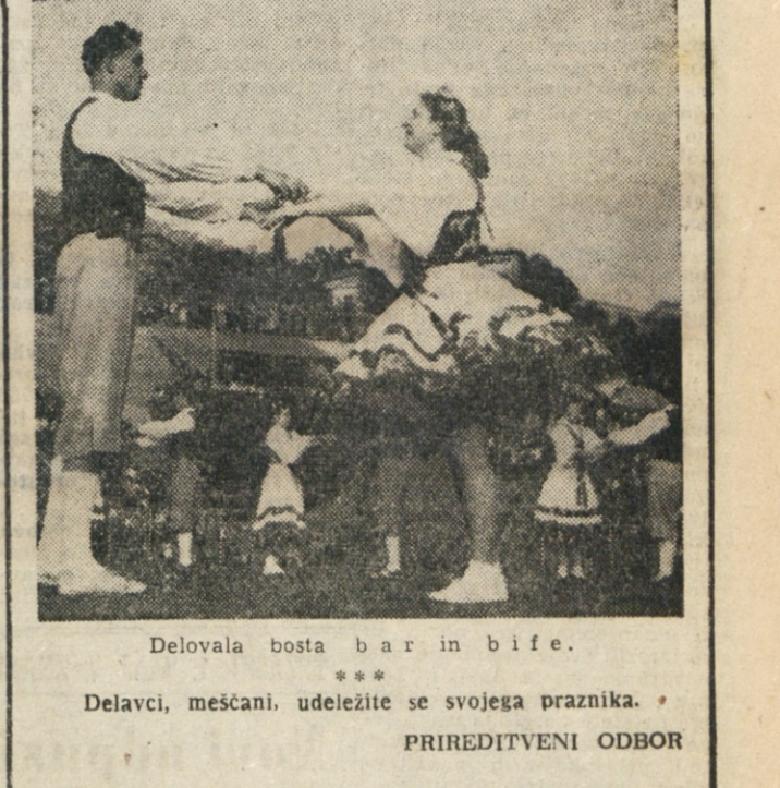
Delovala bosta bar in bife. Delavci, meščani, udeležite se svojega praznika. PRIREDITVENI ODBOR

IZ DOLINSKEGA OKRAJA: Prvi avtobus odpelje iz Doline ob 13. uri skozi Boljuncem in Domjo, drugi pa ob 14. uri iz Boljunca skozi Boršt na stadion »Prvi maja«. IZ NABREZINSKEGA OKRAJA: Avtobus odpelje iz Sempolaja izpred Furlanov ob 12.30 in gre mimo Bajje in Kresije. Iz Saleza odpelje ob 13. uri, iz Zgonika ob 13.10 in iz Gabrova ob 13.20. Vaščani Zgonika naj gredo na avtobuse v Gabrovec ali Salez. Prvi avtobus odpelje s Proseka ob 14. uri in se ustavi na Kontovelu. Naslednji avtobus vozi s predelkom pol ure od prvega. Tudi v Opčin bodo zaporedoma vozili avtobuse. Prvi odpelje izpred Fabiča ob 13.30 ter zajame se Trebče, Padrice in Bazovico. Avtobus bo vozil do Dodiča, nakar se obrne in gre zopet na Opčine.