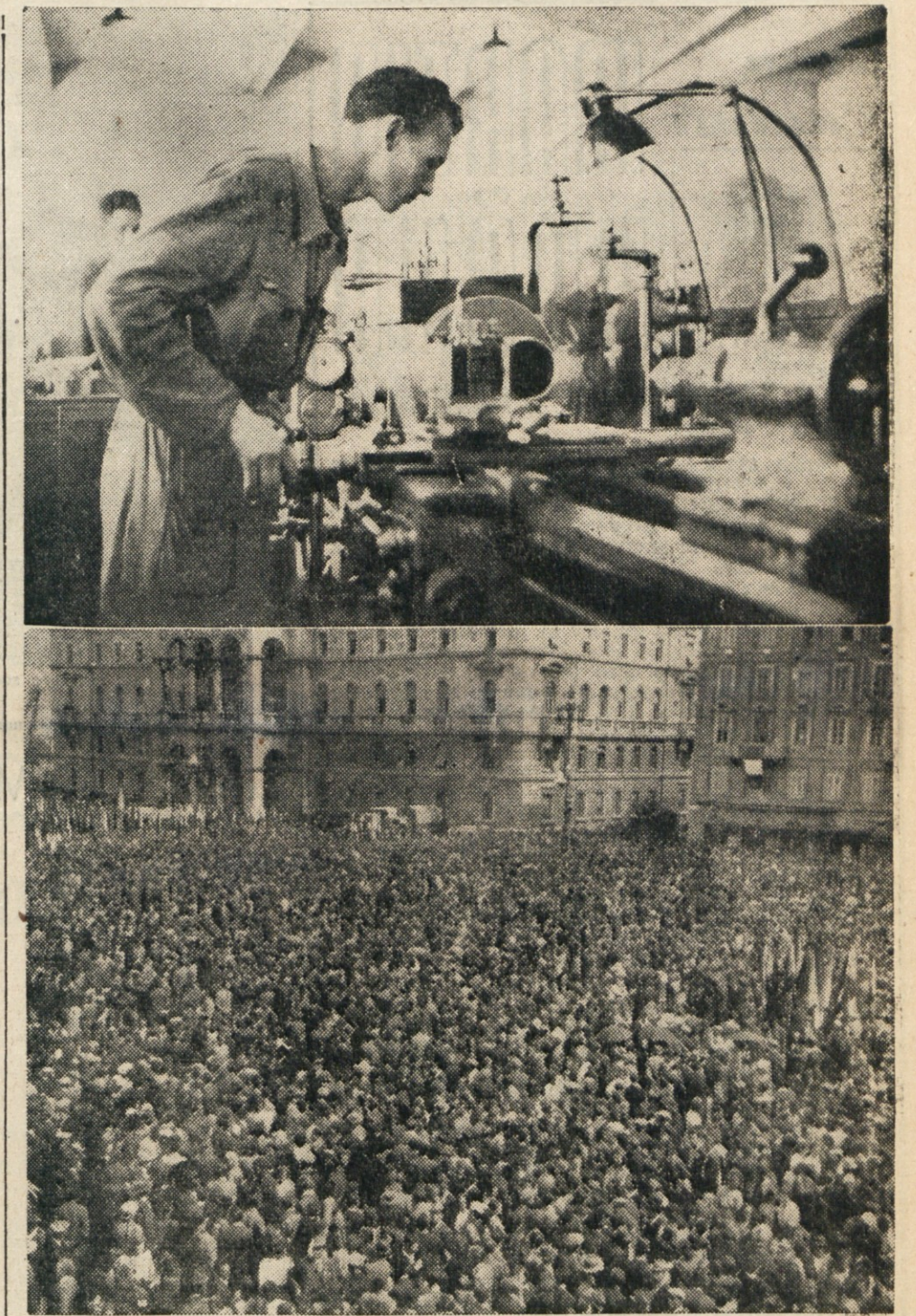
Mogočna manifestacija tržaškega delavstva 1. maja 1946 na Trgu Unità

majem, četudi so se v zaledju še vršile borbe proti jedru 97. nemškega korpusa na reški fronti in je sovražnik še dajal odpor v nekaterih izoliranih postojankah, kot na primer na Opčinah, v Pulju ter posameznih točkah v Trstu. Tu so se obkoljeni Nemci zagrizeno borili v upanju, da bodo prišli zavezniki, in se tako raje predali njim kot pa partizanom. Nemci so se še vedno ogorčeno borili v sodnijski palači, pri Sv. Justu, na Revoltelli in na Konkonelu. Sodnijsko palačo je napadla 10. brigada Dvajsete divizije. Dne 2. maja ob 4. popoldne so Nemci izobesili belo zastavo. Prav v tistem trenutku pa je privzelo pred stavbo kakih 7 ali 8 angleških tankov. Cim so jih Nemci upredali, so zastavo spet sneli ter nadaljevali z borbo v upanju, da se bodo z Angleži laže pogodili. Njihov odpor je bil strt, šele proti večeru, potem ko so bili borci 10. brigade pod zaščito tankovskih topov izvršili nanje močan naskok ter prodiril v samo stavbo. Kmalu za tem je bila zavzeta Revoltella. Posadko pri Sv. Justu sta likvidirali 4. brigada Dvajsete in 8. brigada Devete divizije. Nemci na Konkonelu pa so se predali