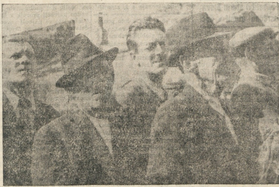
Spričo resnega položaja kmetijstva, se kmetovalci našega področja vse bolj in bolj zavedajo, da je za njegovo izboljšanje potrebna enotna in organizirana borba.