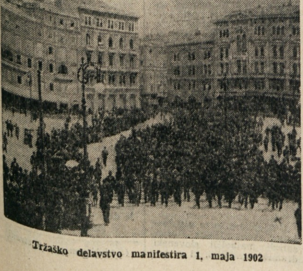
Tržaško delavstvo manifestira 1. maja 1902

Nje gubnega toraj, če so tudi tržaški zavezniški obrtniški in predvsem industrijski delavci kar z navdušenjem sprejeli borbo za osemurni delavnik. Toda rekli smo, da so to borbo sprejeli zavednejši, organizirani delavci, kajti računati moramo, da se je proletarij državnimi ustanovami, pred tedaj šele ustvarjal in to predvsem z viškom podeželskega, t. j. kmečkega prebivalstva, ki je kmehal v mesto in prišel s seboj vse posebnosti kmečkega konservativizma in bil seveda brez najosnovnejših zarodkov razredne zavesti. Ne moremo sicer trditi, da danis do konca prejšnjega stoletja, ali bolje, do leta 1902, posamezne skupine tržaških delavcev sploh praznovala 1. maja. Nasprotno! To je bila že stara navada, le da je imela v večini povsem druge vsebine. Delavci posameznega podjetja ali vsaj del teh, si je ob 1. maju vzel «prost dan» in te skupine so se zbirale v okoliških gostinjah ali kar na travnikih ter tam zalivale obilnej-