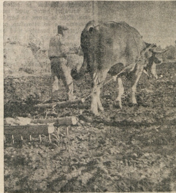
S trudom in težavo vola brano po kosu preorane polja, medtem ko traktor hitro in temeljito opravlja svojo nalogo.