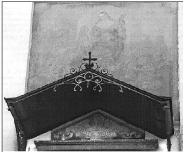
Freska na nunski cerkvi v Škofji Loki