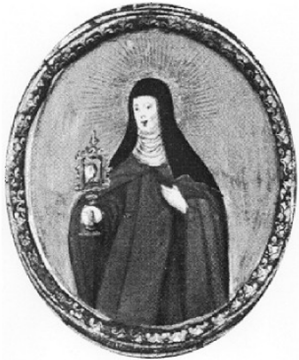
Sv. Klara, Kronika loških klaris, detajl.

S tem se končuje predstavitev drugega dela Kronike loških klaris, ki obsega vstopne redovnic – klaris v 18. stoletju in datume njihovih smrti vse do leta 1830. Loški klariški samostan je bil leta 1782 razpuščen in predan v upravo uršulinkam. V samostanu bivajoče klarise so večinoma prestopile v nov red in umrle kot uršulinke. Pisanje Kronike se z letom 1782 ne konča, ampak se nadaljuje, vsebina pa časovno že presega postavljeni okvir, zato zgodnje uršulinsko obdobje loškega samostana še vedno ostaja bolj ali manj neraziskano in pomeni nov izziv za prihodnje raziskovanje.