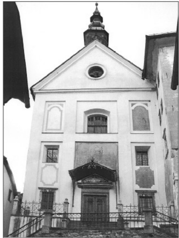
Nunska cerkev v Škofji Loki