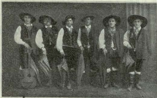
Fantovski kvintet «Slovenski Javornik» ob prvem nastopu ob 25letnici pevskega društva «Sava» na Jesenicah.

Pevsko društvo «Slavec» se že pripravlja za proslavo 50letnice svojega obstoja, ki bo o binokostih leta 1934. Pokroviteljstvo nad prireditvijo je prevzel Njegovo Veličanstvo kralj Aleksander I.