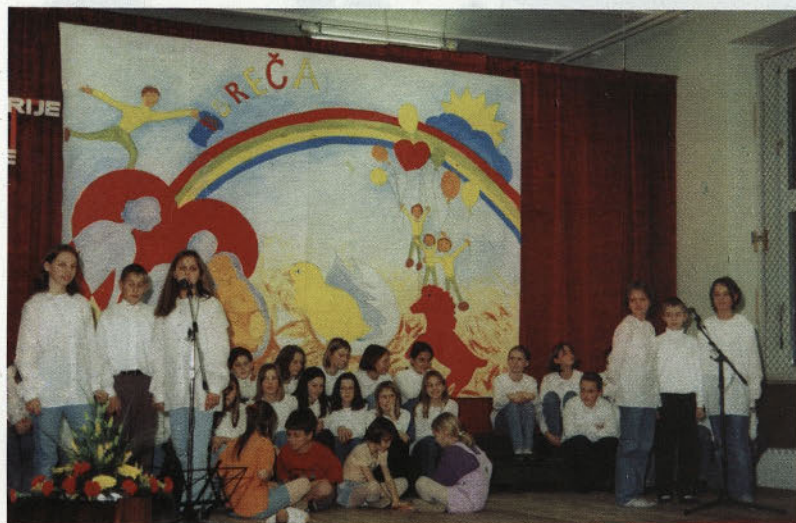
Dan šole 1996