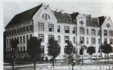
Osnovna šola Mladika 1902

V šolskem letu 1996/97 smo na šoli izvajali projekt nivojskega pouka slovenskega jezika in matematike v sodelovanju z Zavodom republike Slovenije za šolstvo. Projekt smo predstavili tudi v Ljubljani na dnevih