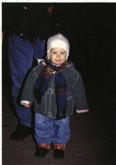
V lepem vremenu na letošnje MARTINOVO so na ptujskih ulicah praznovali tudi najmlajši Ptujčani.