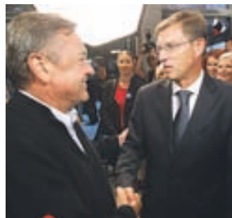
Sklenila sta dogovor med vlado in glavnim mestom.

Združena lista je izrazila željo, da vlada do razkritja celotne vsebine pogajanj od Bruslja zahteva ustavitve pogovorov o trgovinskem sporazumu TTIP, o katerem bi morali izvesti posvetovalni referendum. Kot so dodali v svojem predlogu, bi bil za nas najboljši posvetovalni referendum.