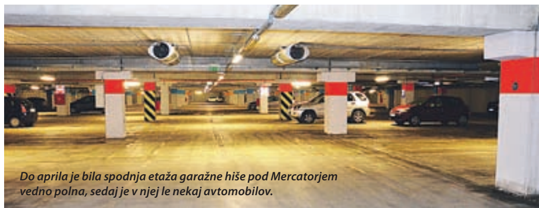
Do aprila je bila spodnja etaža garažne hiše pod Mercatorjem vedno polna, sedaj je v njej le nekaj avtomobilov.

Na MO Velenje trdijo, da je parkiranje v velenjskih garažnih hišah najcenejše v državi, verjetno tudi v Evropi – Kam so izginili avtomobili?