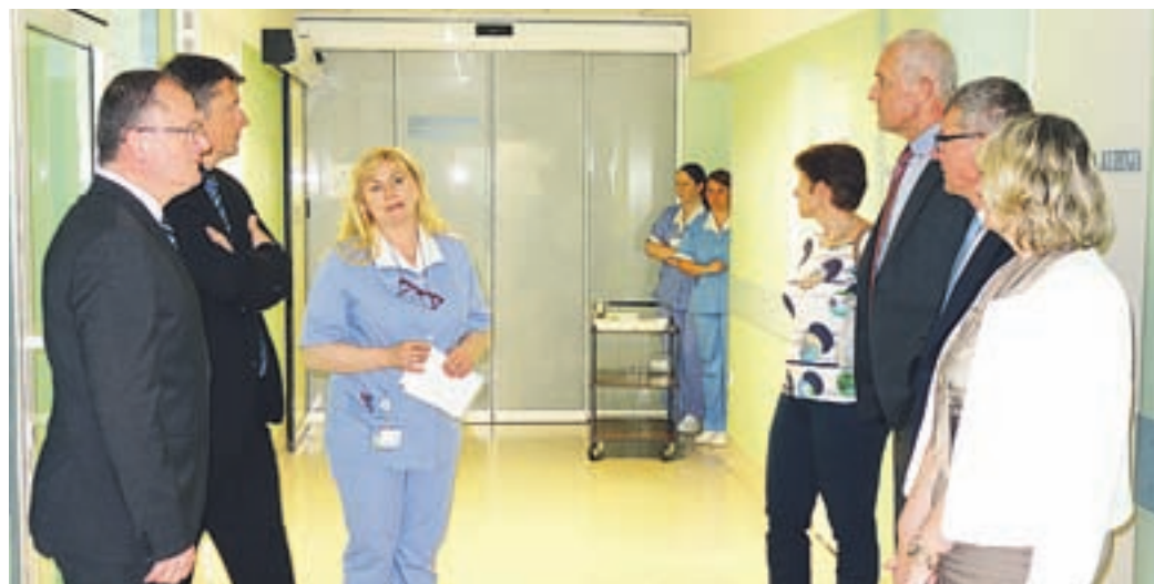
Med ogledom sodobnih bolnišničnih prostorov