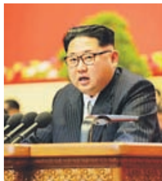
Kim Džong Un želi konsolidirati svojo oblast.

Turški predsednik Erdogan je Evropski uniji odločno sporočil, da Turčija ne bo spremenila protiterorističnega zakona, čeprav je to pogoj EU za odpravo vizumov za turške državljane.