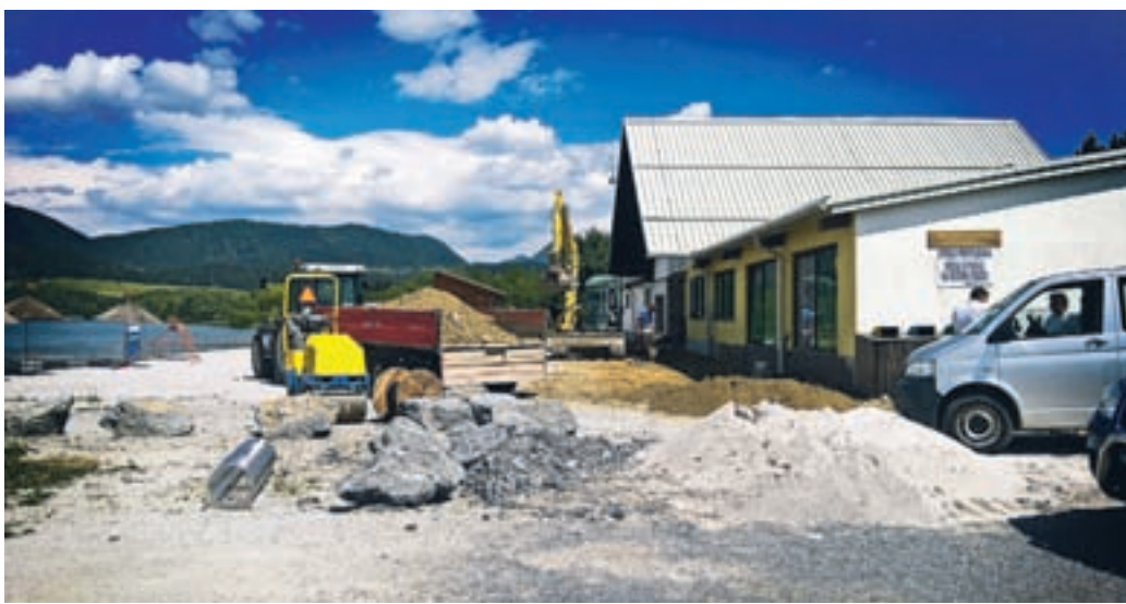
Letos bo plaža dobila dodatno gostinsko ponudbo. Plato, na katerem bodo postavili kioske za prodajo prigrizkov in sladoleda na kepice, že stoji, gradbena dela težejo tudi ob čolnarne, ki bo dobila novo vodovodno in električno napeljavo.