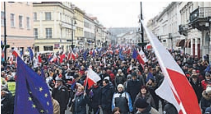
V Varšavi se je zbralo okoli 240 tisoč ljudi.

Po osvoboditvi zaseženega območja iz rok Islamske države v Iraku so tam odkrili že 50 množičnih grobišč.