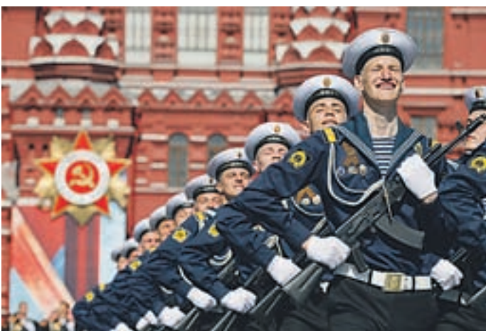
Rusi so znova pripravili veličastno paradu.

V Topolšici so zaznamovali obletnico osvoboditve in konca 2. svetovne vojne pri nas.