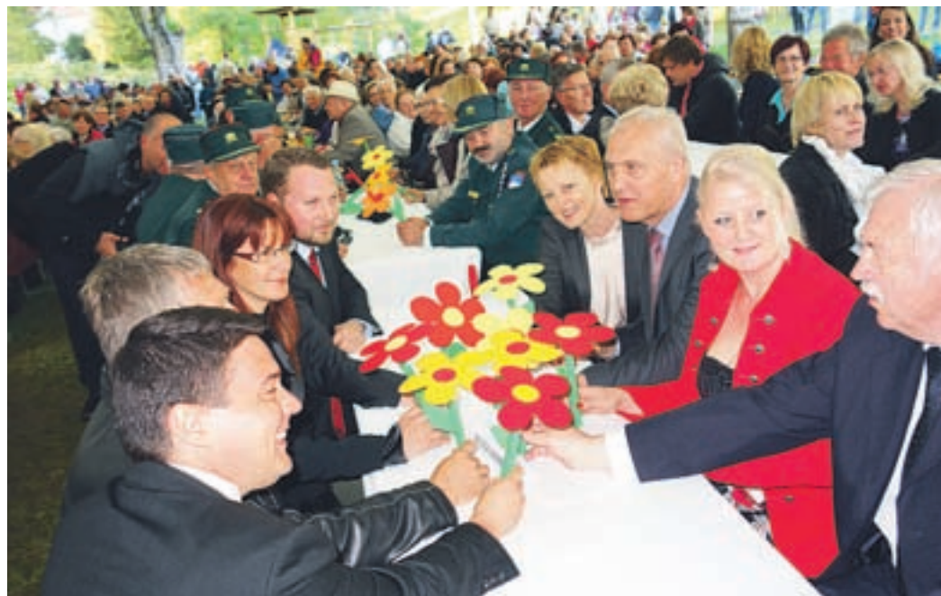
Tudi letos je zaznamovanje 71. obletnice od podpisa kapitulacije in s tem konca druge svetovne vojne privabilo v Topolšico veliko ljudi.

edino prav. Proti fašizmu in proti nacizmu. Odločili smo se za preživetje in lepšo prihodnost.« Kot je še poudarila Katičeva, je narodnoosvobodilni boj postavil temelje današnji samostojnosti in suverenosti, katerih 25-letnica je pred nami, »saj brez osvoboditve ne bi bilo osamosvojitve, zato ne bomo dovolili, da se kjerkoli zmanjša pomen slovenskega