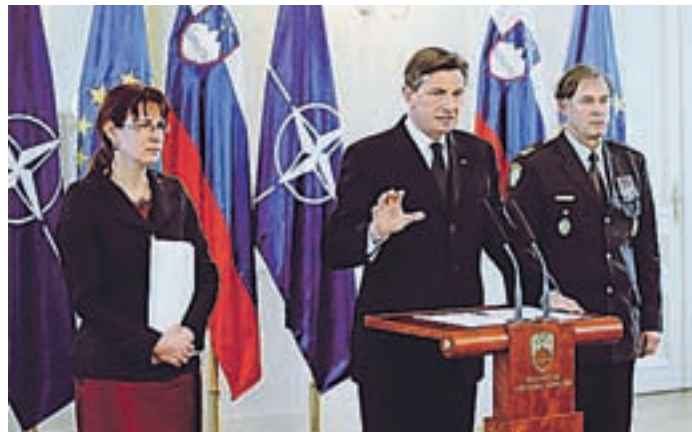
Predsednika Pahorja skrbi (ne)pripravljenost Slovenske vojske.

Odbor državnega zbora za delo je potrdil dopolnjeni predlog novele zakona o socialnem varstvu, ki med drugim ukinja obvezno pripravništvo za diplomante socialnega dela.