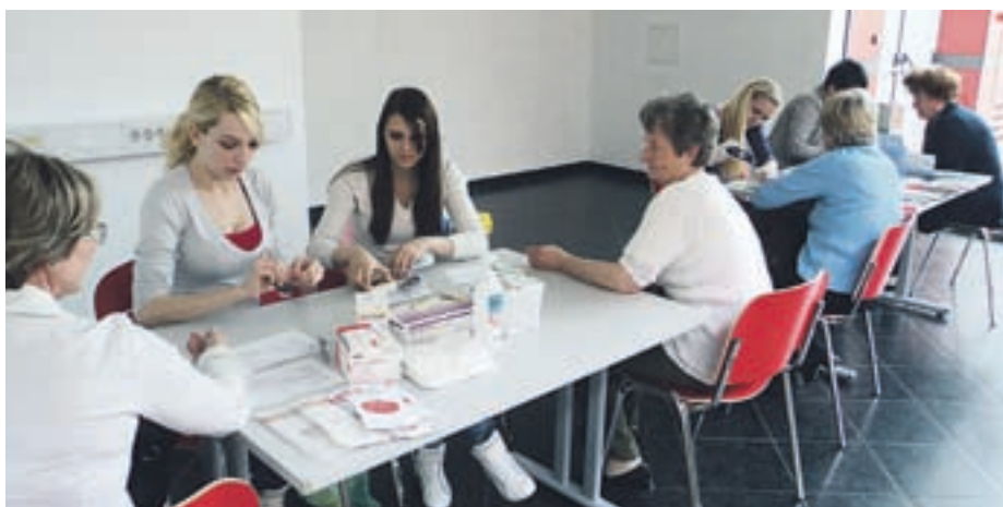
Ob tednu RK izvajajo tudi meritve krvnega tlaka, sladkorja in holesterola

ne skupnosti. Včeraj je pripravilo na sedežu združenja dan odprtih vrat, brezplačno merjenje krvnega tlaka, sladkorja in holesterola. Slednje so izvajali tudi v Šoštanju. Učencem prvih in drugih razredov so predstavili pomen RK in njegovo delo, teden pa bodo sklenili v soboto, 14. maja, z regijskim preverjanjem znanja ekip prve pomoči RK in CZ v Velenju. Med 19 prijavljenimi so tudi tri ekipe iz Šaleške doline – poleg ekipe območnega združenja mMestne občine Velenje tudi ekipa Goreinja, ki se tradicionalno uvršča med najboljše.