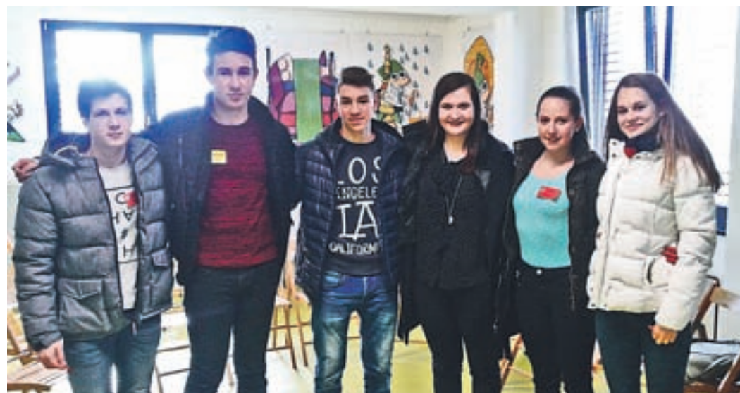
Predstavniki regije na nacionalnem otroškem parlamentu v Ljubljani

oziroma psihičnega nasilja. Večina nasilnežev, ki ustrahuje ali izvaja psihično nasilje, pa ostane nekaznovanih, ker veliko ljudi ne opazi tako imenovanih poškodb, ki prizadenejo človeška čustva in ne kažejo fizičnih poškodb. Nasilje, internet in okolica, v ka-