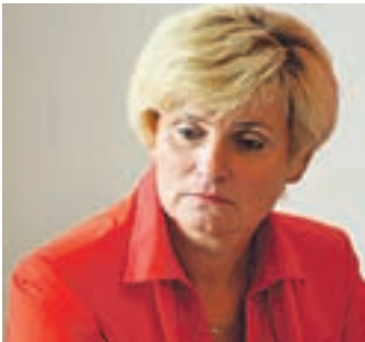
Zaradi afer z jopicami je Bojana Muršič odstopila z mesta podpredsednice DZ in z mesta občinske svetnice.

Namestnik generalnega sekretarja zveze Nato Alexander Vershbow je med obiskom v Ljubljani opozoril, da mora Slovenija obrniti trend pomanjkanja sredstev za obrambo.