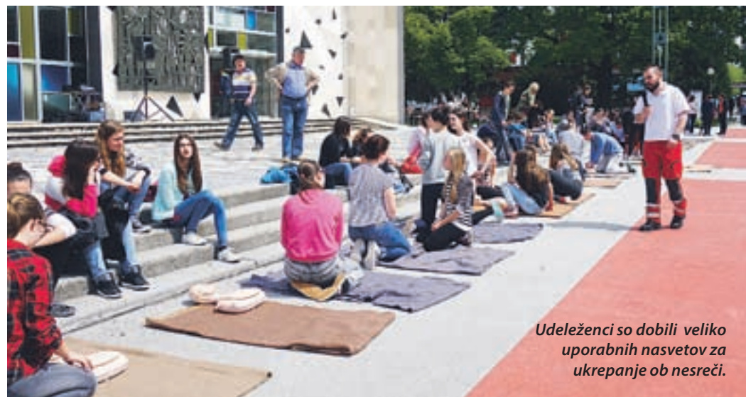
Udeleženci so dobili veliko uporabnih nasvetov za ukrepanje ob nesreči.

Glavni namen tehničnega dneva, na katerega vedno povabijo tudi druge – in številni dogajanje z zanimanjem spremljajo – je dopolnitev znanja o prometni varnosti ter seznanitev s konkretnimi in uporabnimi nasveti za ukrepanje ob prometnih nesrečah.