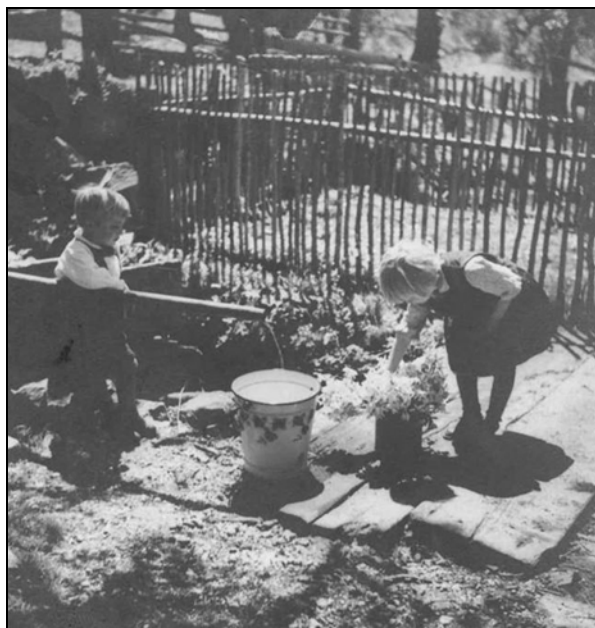
Igra na vrtu (SI_ZAL_LJU/0342, Fototeka).

O igri in zabavi konkretnih otrok in mladostnikov lahko največ izvemo iz spominske literature. Pomembna je tudi zato, ker nam precej natančno