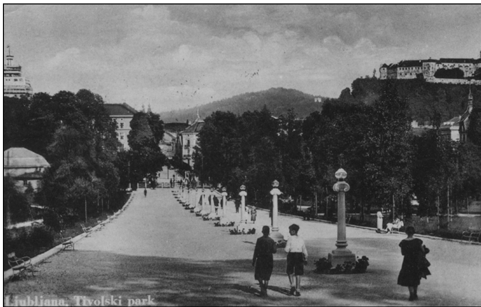
Ljubljana – sprebajališče v Tivoliju, trideseta leta 20. stoletja (SI_ZAL_LJU/0342,).