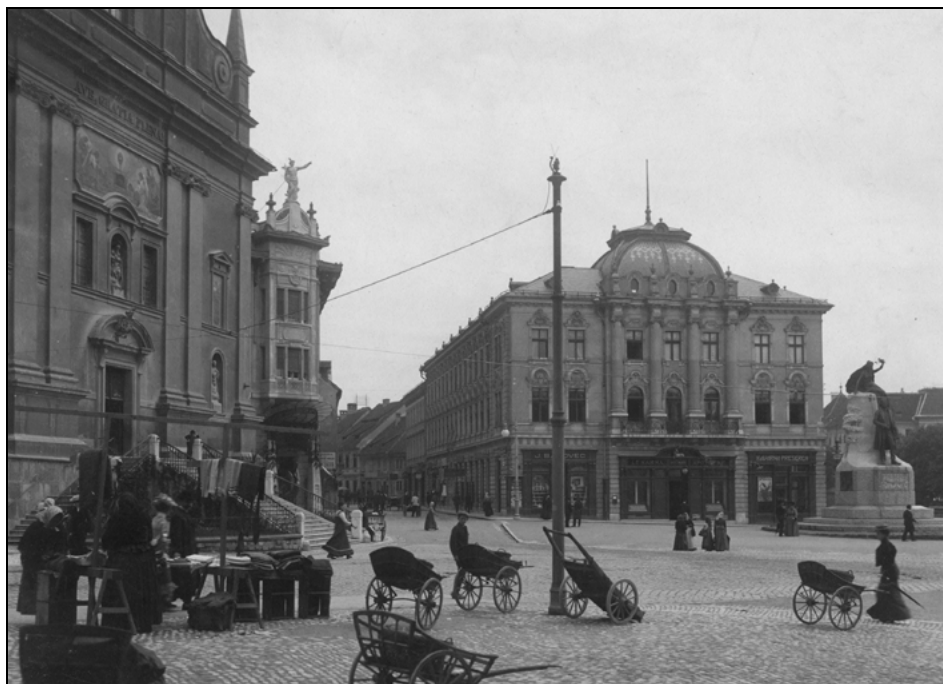
Marijin trg (danes Prešernov trg) z vozički branjevok oz. mlekaric, po letu 1905.