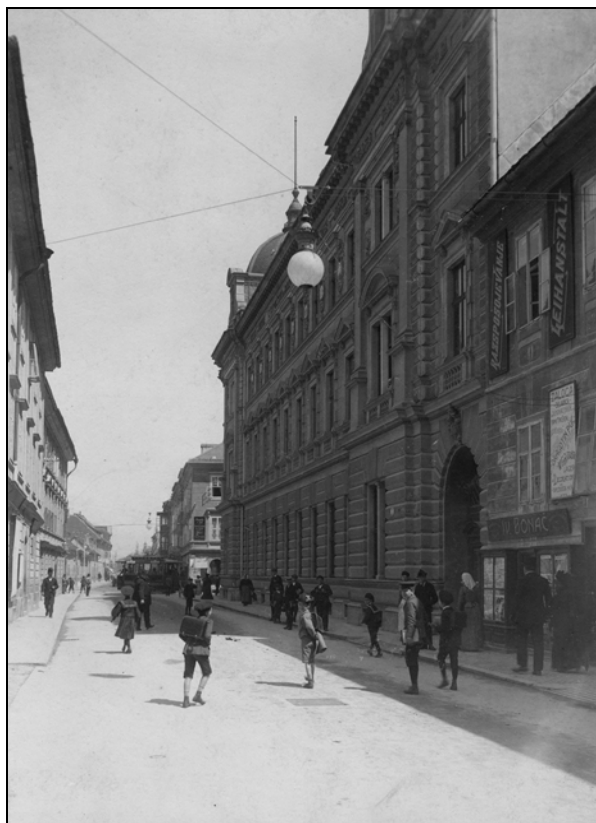
Šolarji na Šelenburgovi ulici (današnja Slovenska cesta), okrog 1900.

taki družini sem začel zahajati v krčmo in cirkus. [...] Takrat so gimnazijski postopači zahajali v krčmo na Fritci [...] Marsikateri popoldan smo izostali z šole in šli tja na pivo in kegljat. Kadili smo cigare viržinke. [...] Pri igri sem imel srečo in spretnost, pa sem vedno dobival. [...] Nekoč sem prišel iz cirkusa šele o polnoči domov. Cirkus je bil postavljen na sedanjem Krekovem trgu. Neumorno je šestlanski orkester godel 'štrasake' (Zitterpolka). [...] Takrat je bilo zadnjič, da me je oče hotel kaznovati s šibo. 6