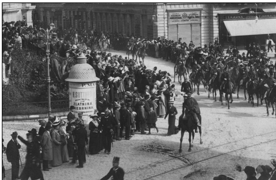
Vseslovenski sokolski zlet v Ljubljani, povorka skozi mesto, 1904.