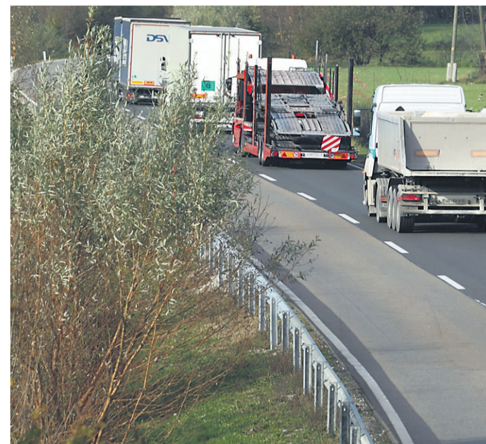
Fotografija je simbolična

V nadaljevanju je še izpostavil, da je takšen tovarni promet močno znižal življenjski standard občanov: »Tovornjaki odpeljejo, a njihov škodljiv odtis ostane in