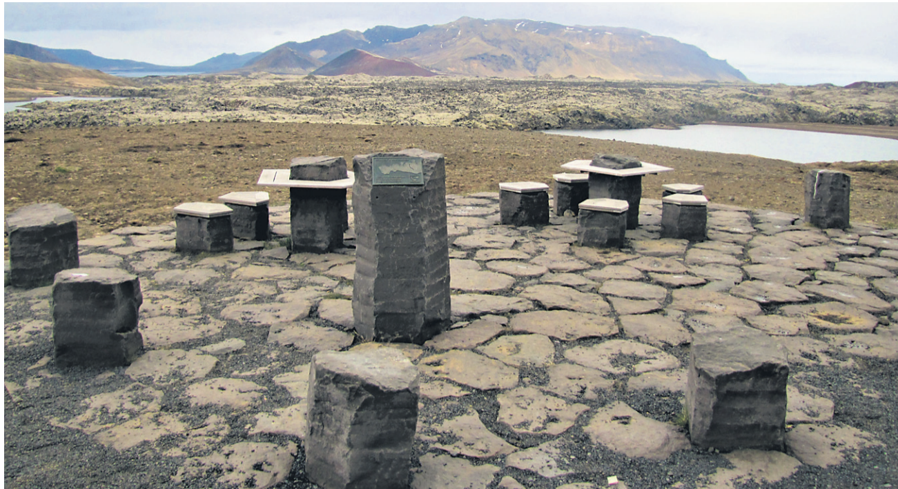
Eno izmed več zgodovinskih prizorišč političnih taborov

Severni del ob morju je že pregovorno zelo mrzel, zato sem se držal bolj notranjosti. Sicer so me poskušali pregovoriti, da naj vseeno zavijem na polotok trolov, kjer bi me čakalo nešteto krasnih dolin, votlin in hribov, vendar bi to takoj pomenilo dodatnih 200 kilometrov vožnje, trolji pa so tako ali tako živeli samo v njihovih sagah. Kljub temu je glavna cesta na severu Islandije prava paša za oči in mi ni bilo žal, da sem ubral to pot.