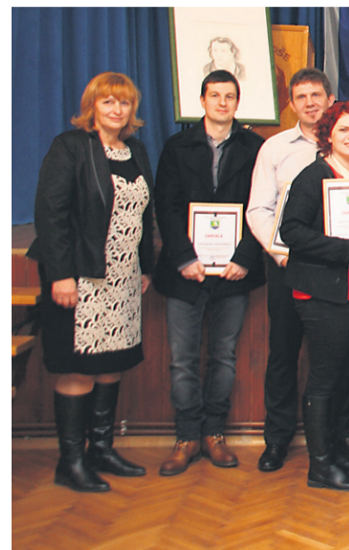
Na Hajdini so v torek obeležili kulturni