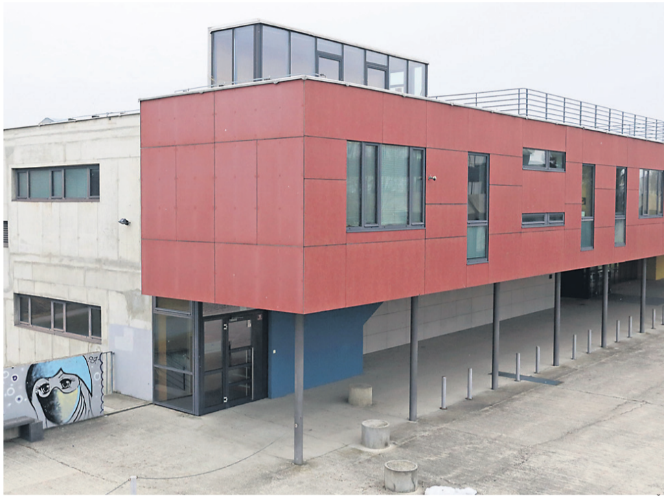
Sanacija strehe bo po besedah Centrihove nujna še to pomlad.

Pristojno ministrstvo naj bi rešitev iskalo v sodelovanju z ministrstvom za infrastrukturo. Na nji-