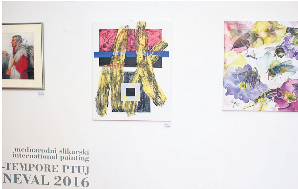
mednarodni slikarski international painting -TEMPORE PTUJ NEVAL 2016

Pravočasno oddana dela bo anonimno ocenil vsak član mednarodne strokovne žirije, o zmagovalcih bo odločil seštevok posameznih ocen. Žirija bo podelila