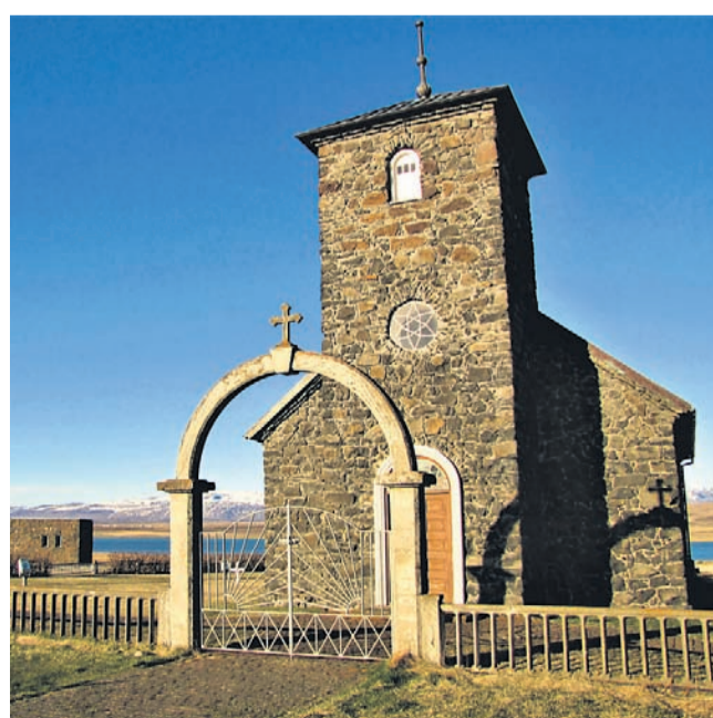
Skoraj tisoč let stara cerkva sameva med pašniki.

Postali boste zelo samozavestni in se plemenito soočili z dohodnimi zadevami. Okrepil se bo duh prijateljstva in harmonija romantike se bo ojačala. Odločna energija vas zaznamuje v pogledu službe, dobro od rok vam grdo tako delo kot delovne obveznosti. Počasi se vendarle daleč pride.