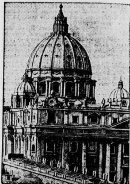
Veličastna kupola cerkve sv. Petra.

kansko kupolo, s svetimi vrati in s stotinami drugih zgodovinskih zanimivosti, ki so bile skozi desetletja in stoletja in so še največja privlačnost za domače in tuje obiskovalce svetnega mesta.