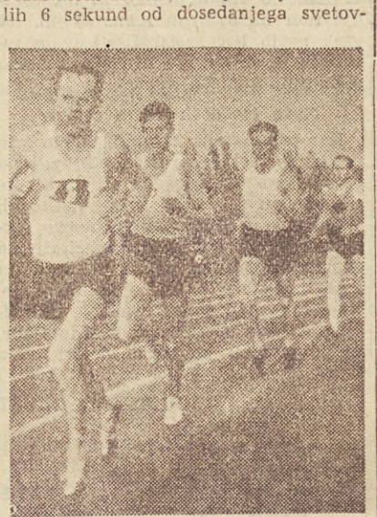
Emil Zatopek (prvi) je postavil nov rekord na 10.000 m

Praga, 23. oktobra. Na atletskem tekmujevanju v Vitkovcih je včeraj Emil Zatopek letos že drugi izboljšal svetovni rekord v tekni na 10.000 m z rezultatom 29:21,2, kar je boljše za celih 6 sekund od dosedanjega svetov-