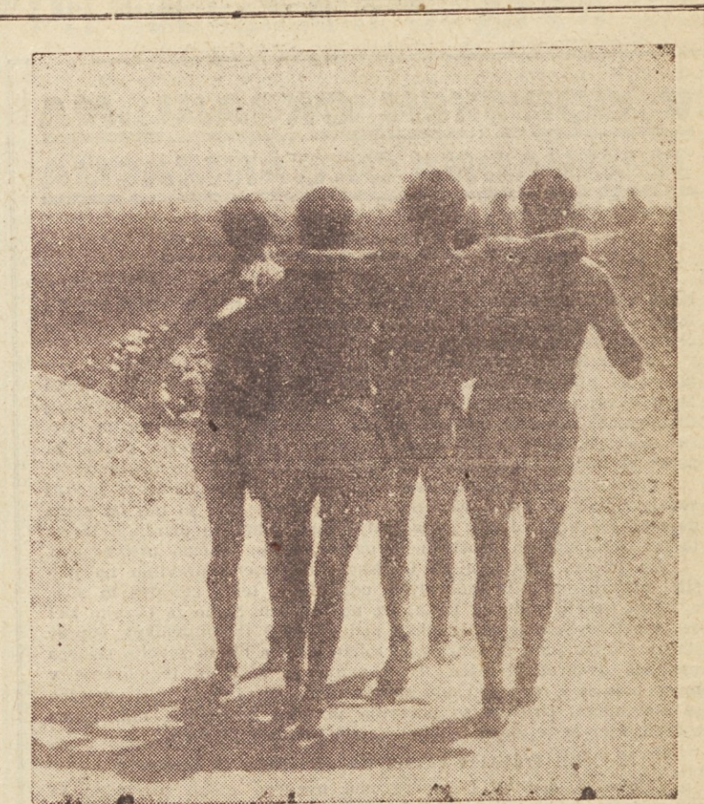
Partizanski marš je najtežja atletska disciplina. Mnogokrat je treba podpirati onemoglega tovariša, kajti predpogoj je: na cilj morajo prispeti vsi tekači istočasno. Partizanski marš zahteva od športnikov mnogo samopremagovanja, tovarišta in izdržljivosti. Letošnje državno prvenstvo je bilo danes v Bosanski Dubici. Podrobno poročilo bomo objavili v prihodnji številki.