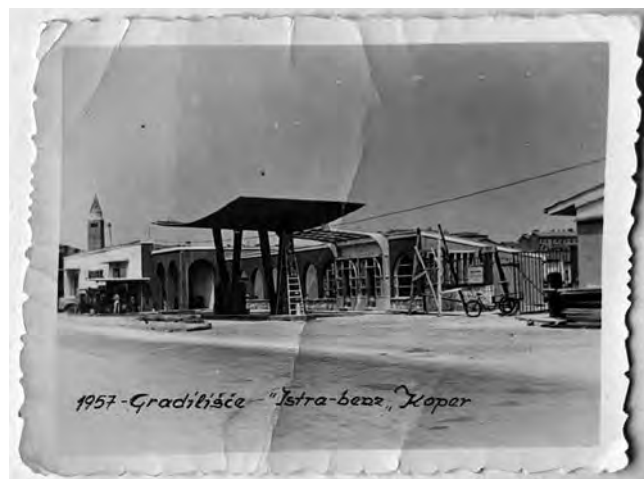
Bencinski servis Koper 1 in upravna stavba s skladišči v Kopru pri Mudinih vratih ob koncu gradnje leta 1957