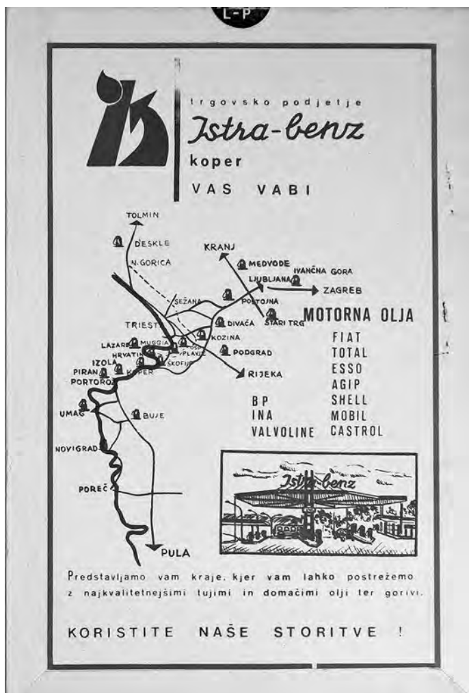
Karta bencinskih servisov v sredini 60. let