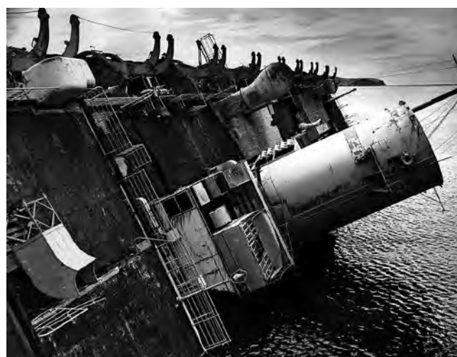
Nasedla in poškodovana ladja Rex je postala po vojni »največji rudnik železa v Jugoslaviji« in še pred tem pa velik »rezervoar nafte.«