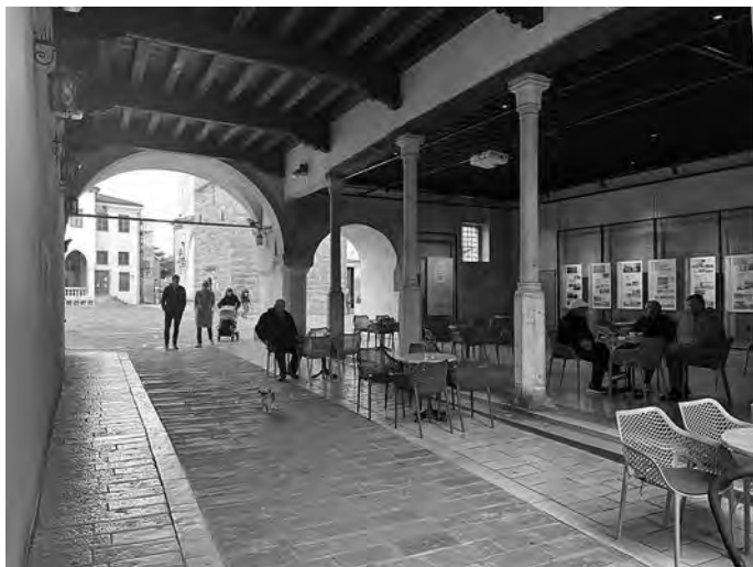
Postavitev razstave v Mali loži pod Pretorsko palačo v Kopru z Matejo Tomažinčič, oblikovalko razstave in publikacije