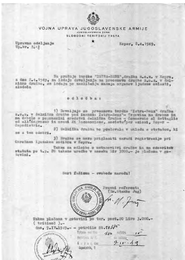
Odločba VUJA za cono B STO z dne 9. 4. 1949, o preoblikovanju podjetja Istra-Benz d. z. o. z. v delniško družbo (SI PAK/0170, t. e. 40)