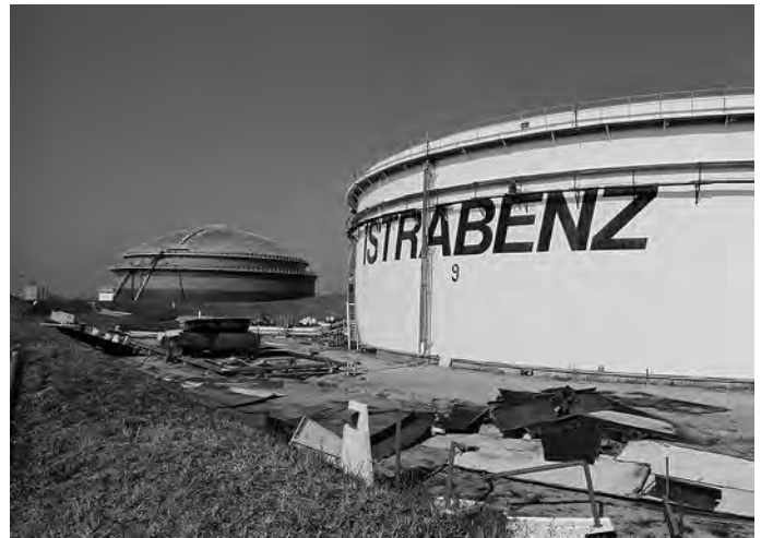
Na Serminu so zgradili osrednja skladišča naftnih derivatov v Sloveniji