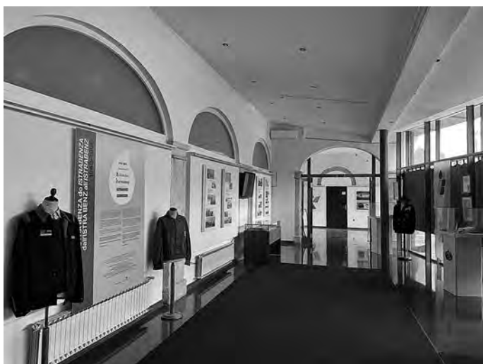
Postavitev razstave v avli PAK