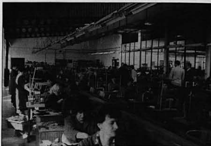
Sodobna proizvodna hala

Jasno pa je, da je osnovni cilj organizacija podjetja, ki posluje z dobičkom. Glede na sedanje stanje (majhna proizvodnja v zadnjih letih, finančna situacija...) predvidevamo, da bo FOGS pod okriljem Alpine sposoben ustvariti dobiček v obdobju dveh do treh let in takrat se bo začela investicija vračati. Za Alpino pa to že takoj pomeni, da smo pridobili zanesljivega sodelavca, ki postaja »več« kot kooperant. Na ta način smo zmanjšali nevarnost glede predvidljive in nepred-