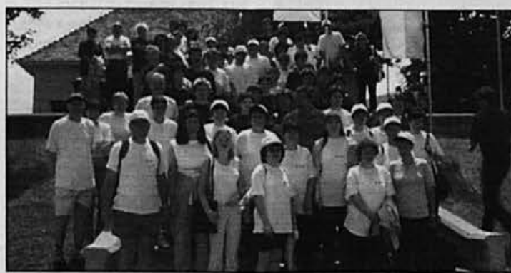
Naši v Slovenskih Konjicah – Izraz na obrazih priča, da se imajo lepo.

9. junija se je preko sedemdeset članov Svobodnega sindikata udeležilo tretjega športnega srečanja delavcev tekstilno usnjarsko predelovalne industrije Slovenije. Letos je bilo v Slovenskih Konjicah. Iz Žirov smo se odpravili v zgodnjih jutranjih urah in v veselem vzdušju prispeli na prizorišče dogajanja.