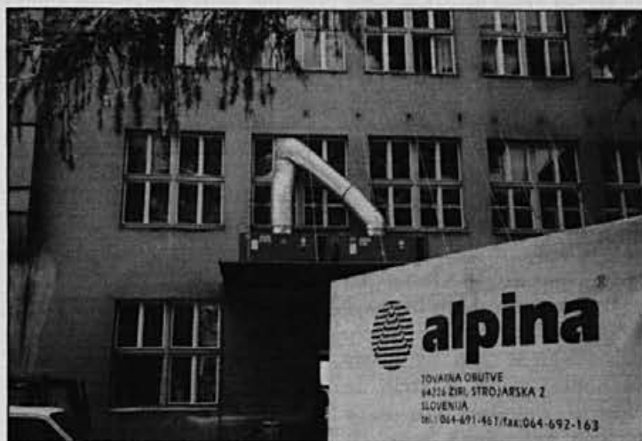
Klimatska naprava za šivalnico