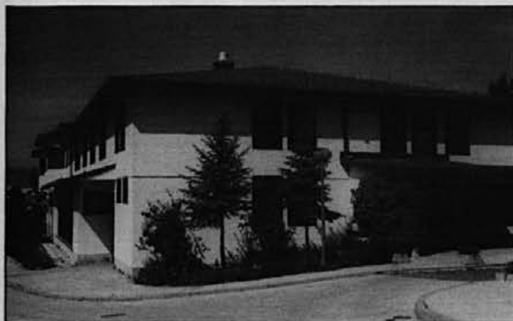
Stavba FOGS-a je bila po načinu izvedbe in tehničnih rešitvah kandidirana za nagrado za najboljšo arhitektonsko rešitev na območju bivše Jugoslavije.

janj je pokazal, da je bila to dobra poteza. Prišlo je do hitrega razvoja podjetja. Izvažali so tudi na evropsko in ameriško tržišče. Veliko pozornosti so posvečali kakovosti. Naročila so bila iz leta v leto večja.