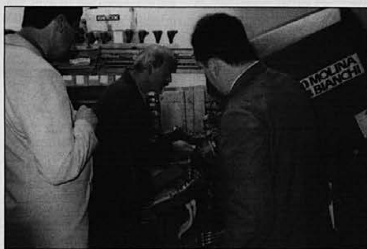
Tovarna ima sodobno opremo in prostore, delavci pa so usposobljeni tudi za zahtevna dela.

Podjetje je imelo svojo ambulanto z zdravnikom in medicinsko sestro ter vso potrebno opremo.