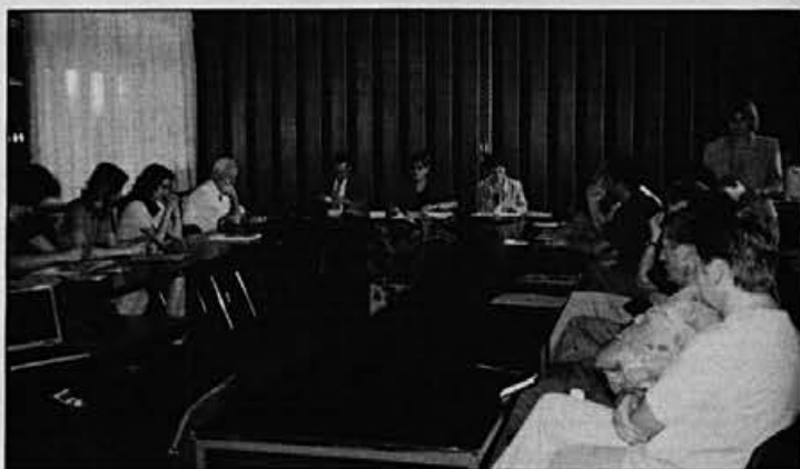
Skupščina je potekala po načrtih in brez zapletov.

Nova pa je pristojnost skupščine, da sprejme sklep o podelitvi razrešnice članom uprave in nadzornega sveta, katerega skupščina sprejme hkrati s sklepom o uporabi bilančnega dobička. Podelitev razrešnice ne pomeni razrešitev članov uprave ali nadzornega sveta s funkcije, kot bi na prvi pogled lahko razumeli, temveč skupščina s tem potrdi in