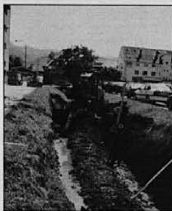
Dela pri ureditvi Jezernice so v polnem teku.