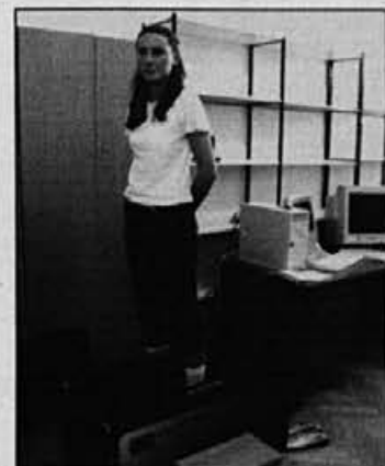
Z novim skenerjem izmerimo obliko stopala.