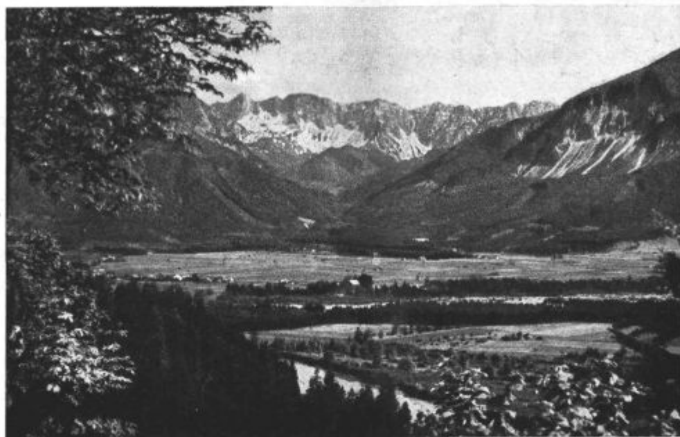
Pogled z Žihpolj na Spodnji Rož in na Košuto.