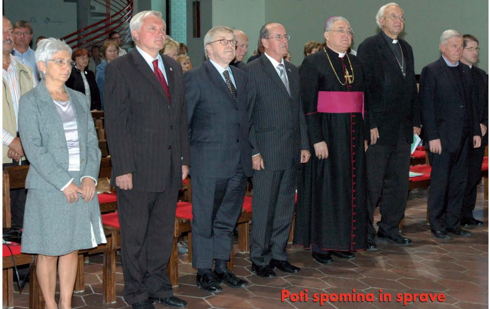
Poti spomina in sprave