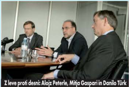
Z leve proti desni: Alojz Peterle, Mitja Gaspari in Danilo Türk

V Sloveniji so volitve za predsednika republike pred vrati. 21. oktobra bodo namreč volilni upravičenci od Kopra do Murske Sobote odločili o novem predsedniku republike. Izvoljeni predsednik bo tretji po vrsti, odkar je leta 1991 Slovenija razglasila samostojnost. Po obdobju Milana Kučana (1990 - 2002) in Janeza Drnovška (2002 - 2007) se letos za najprestižnejše institucionalno mesto poteguje pet kandidatov. Na uredništvu našega tednika smo se odločili, da bomo v naslednjih tednih pripravili intervjuje s tremi favoriti na skorajšnjih volitvah: tokrat objavljamo pogovor z mag. Mitjo Gasparjem, v naslednjih številkah boste lahko brali še intervjuja z dr. Danilom Türkom in evroposlancem Alojzjem Peterletom.