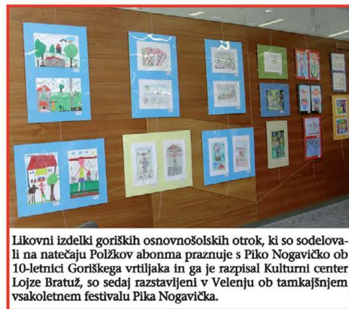
Likovni izdelki goriških osnovnošolskih otrok, ki so sodelovali na natečaju Polžkov abonma praznuje s Piko Nogavičko ob 10-letnici Goriškega vrtljaka in ga je razpisal Kulturni center Lojze Bratuž, so sedaj razstavljeni v Velenju ob tamkajšnjem vsakoletnem festivalu Pika Nogavička.