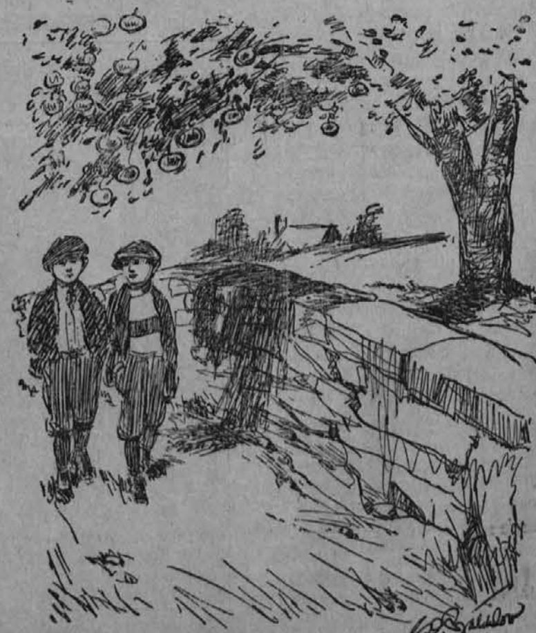
SNAP-SHOOTING THE MILLENNIUM