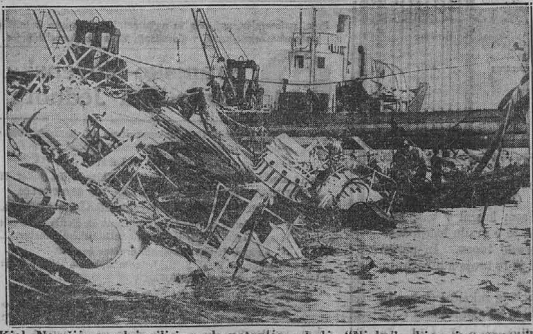
V Kiel, Nemčija, so dvignili iz vode potopljeno ladjo "Niobe", ki se je pogreznila vsled eksplozije. Slika kaže, kako strahovito je eksplozija razmesarila ladjo, pri čemer je bila tudi večina moštva ubita.

se bo njihova deca čimprej potujčila. — Družba utemeljuje te potrebe po takih vrtecih na ta način, da deca slovanskih staršev bi mogla biti od svojega tretjega leta v takem vrtcu, da se privadi italijanščine in opusti slovenščino. Le na ta način, pravijo, bodo imele sedanje ljudske šole uspehe, in ne bo treba otrokom po tri leta hoditi v prvi razred, kakor morajo sedaj, in to samo radi tega, ker ne obvladajo italijanščine. Nadalje ugotavlja družba "Italia Redenta", da spriči devet let, popolnoma italijanske šole, ni zaznamovati skoro nikakih uspehov. — Ta utemeljitev pač pomeni, kako malo koristi italijanska šola splošni izobrazbi slovenskih otrok in kako malo uspeha je vse fašistično nasilje nad našim kraškim ljudstvom in nad njegovo narodno, jezikovno in kulturno lastnino.