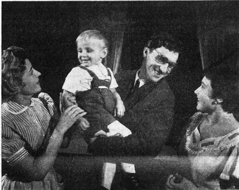
Prizor iz Nušičevega »Dr.« v izvedbi Mestnega gledališča v Ljubljani

Še teže se odločajo zbrani državniki, ali bodo pristopili k evropski trgovinski skupnosti, kamor jih vleče Anglija. Boje se namreč za prednosti pri izvažanju svojih izdelkov v Anglijo.