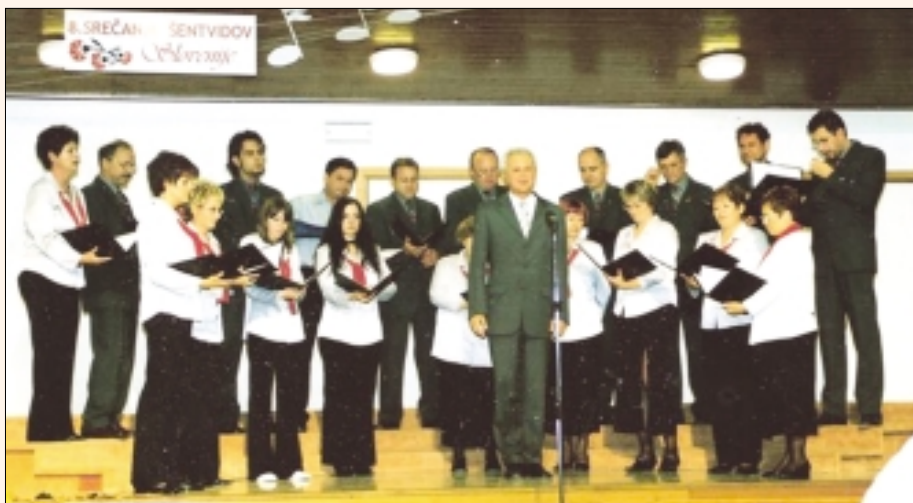
Šentviški zvon na srečanju slovenskih Šentvidov

Mešani pevski zbor Šentviški zvon je začel z