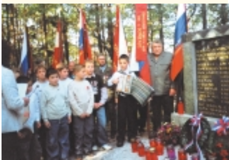
Nastop učencev 4. d na Golčaju