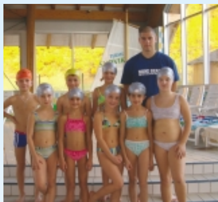
Plavalni tečaj 3. a. in b

V mesecu oktobru smo imeli plavalni tečaj v