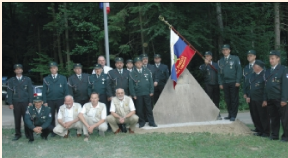
Veterani vojne za Slovenijo ob pomniku na mali Lašni

Slovenije Lukovica iskreno zahvaljujemo. Poleg proslave na Mali Lašni je potekalo še več drugih aktivnosti, s katerimi smo zaznamovali pomembno obletnico, med drugimi tudi 15. tradicionalni pohod po