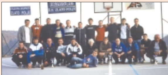
Najboljše ekipe so se veselile uspeha

Letošnjo jesen Zlatopoljci res niso trepetali za lepim vremenom, ki bi jim omogočilo uspešno izvedbo jesenskega malonogometnega turnirja, saj se je uresničila napoved prekrasnega sončnega vremena in s tem spet pravi nogometni praznik na tamkajšnjem igrišču, obdanem z