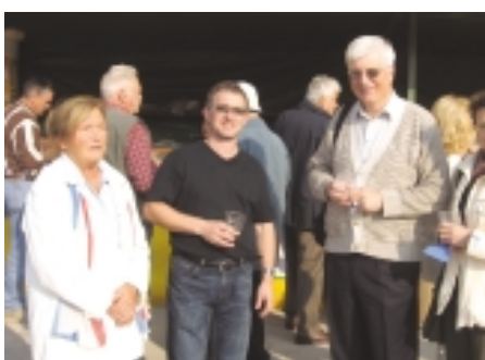
Našo stojnico so obiskali tudi nekateri kandidati za župansko mesto

SLS Lukovica se zahvaljuje vsem volivcem, ki ste nas podprli na lokalnih volitvah. Hvala tudi za podporo med volilno kampanjo in obisk naše stojnice na sejmu v Lukovici 14. 10. Upamo, da se bomo tako lahko še večkrat srečevali, ne le v času pred volitvami.