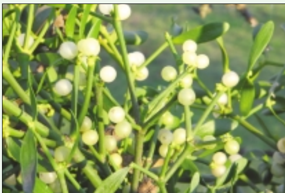
Bele jagode so privlačen okras