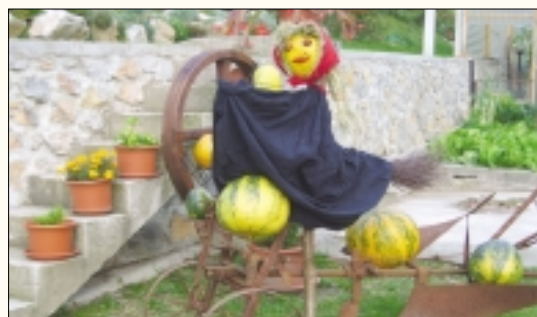
Ena od simpatičnih čarovnic