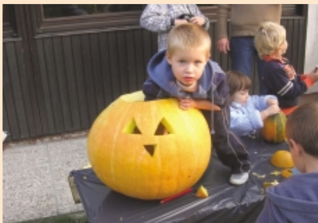
Izrezovali smo buče

Da je petek trinajsti nesrečen dan, za vrtec Medo v Krašnji to ne velja, saj smo imeli ravno na ta dan prireditev Pozdrav jeseni, na kateri smo se imeli zelo lepo. Vzgojiteljice smo otrokom in staršem pripravile različne delavnice, na katerih so izdelovali: