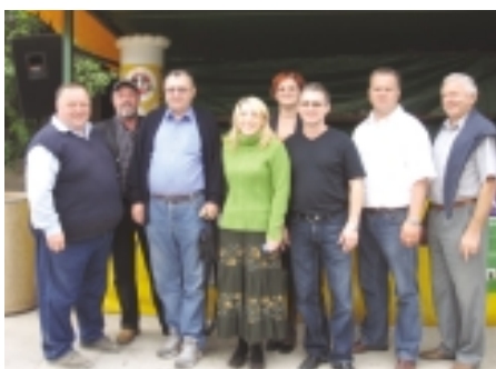
Nekaj kandidatov za svetnike in članov