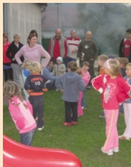
Nastop za starše