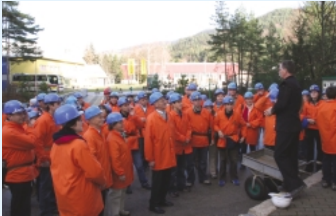
Odpravljamo se na obisk k "Perkmandeljcu"