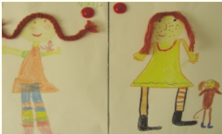
Taka je Pika

Pika Nogavička je že 17. odprla festival ob Velenjskem jezeru. Tudi nekaj učencev OŠ Janka Kersnika z obema podružnicama se je pridružilo pikasti zabavi in uživalo v prelepem dnevu, polnem zanimivih dogodivščin. Vse je bilo v znamenju Pike Nogavičke in zato smo se tudi mi za en dan spremenili v Pike tako, da so nas najprej sfrizirali (naredili kitke in čopke) in nam narisali pikice na nosu. Nato smo se udeležili še ustvarjalnih delavnic. Najbolj zavzeti so celo tekmovali med seboj, komu bo uspelo izdelati čim več različnih izdelkov. Dan je bil živahen, poln smeha in dobre volje. Na koncu smo se igrali še v Pikinem zabavišču in se nato utrujeni vrnili proti domu. Ugotovili smo, da je prav zabavno biti Pika vsaj za en dan v letu, da pa je to pravzaprav tudi naporno. Zato smo sklenili, da bomo naslednji dan zopet šolarji, da pa se Pika pridružimo zopet naslednje leto. En lep Pikin pozdrav vsem, ki festivala niste obiskali - priporočamo.