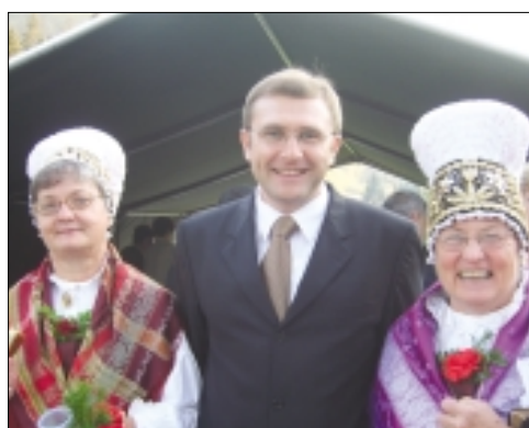
Župan se je rad slikal z gospema v narodni noši