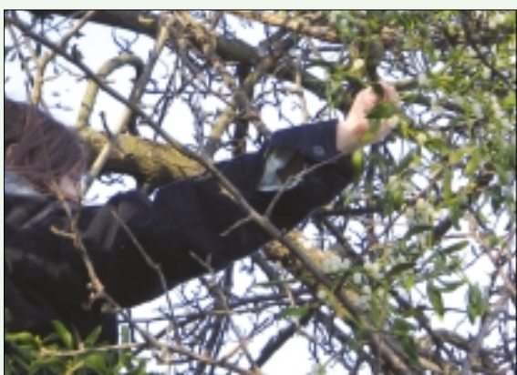
Pri nabiranju je potrebna previdnost

Pozno jeseni, ko drevje odvrže listje, lahko v nekaterih drevesnih krošnjah na golih vejah opazimo različno velike šope nekakšnih zelenih poganjkov. Še posebno na starih sadnih drevesih, kjer skrbne roke sadjarja že dolgo niso opravile potrebnega dela. Na vejah se tako razrašča bela omela, zimzelena grmasto razvejana rastlina. Najraje raste na listnatih drevesih, na jablanah, topolih, jelkah, smrekah, hrastu, lipah. Najlaže pa jih najdemo v starih, neoskrbovanih sadovnjakih.