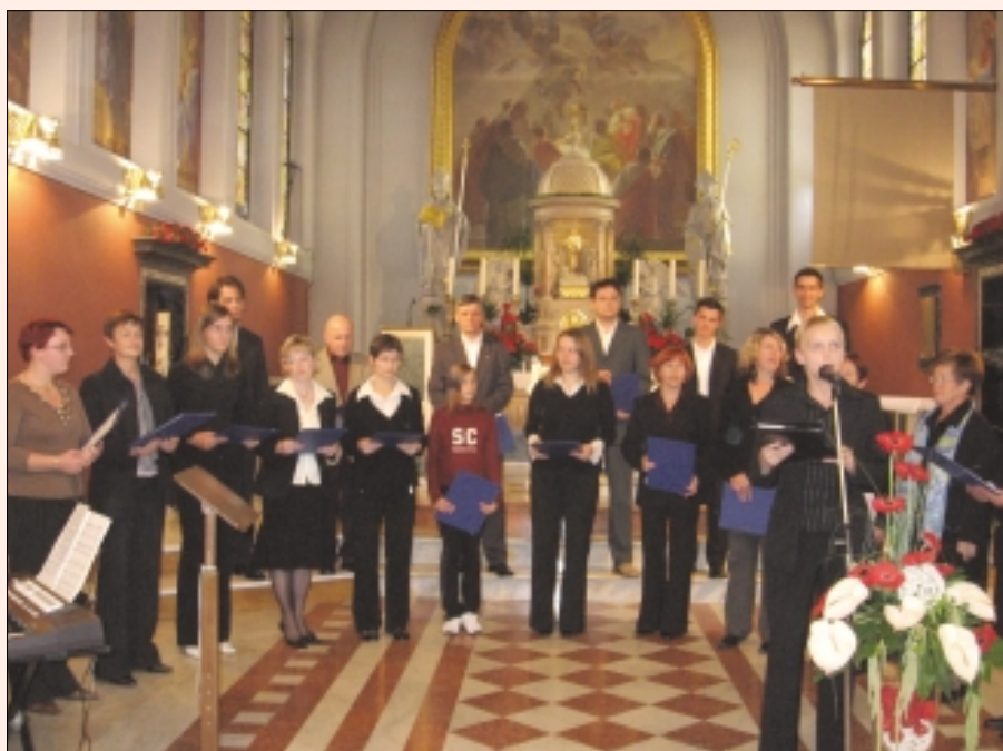
Mešani cerkveni zbor iz Šentvida na reviji

Že uveljavljena revija odraslih cerkvenih pevskih zborov se je letos ponovno dogajala v domžalski cerkvi na drugo oktobrsko nedeljo. Sodelovalo je 13 zborov, ki so v večini primerov odlično izvedeno cerkveno petje, slovenskih in nekaj tujih avtorjev.