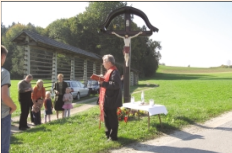
Obnovljeno znamenje na Vidmu je obranilo prvotno podobo