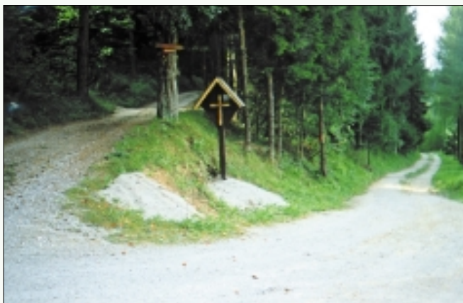
Obnovljeno znamenje na Dolinah

Mesto, kjer stoji leseno znamenje, se je vedno imenovalo 'Pri znamenju'.