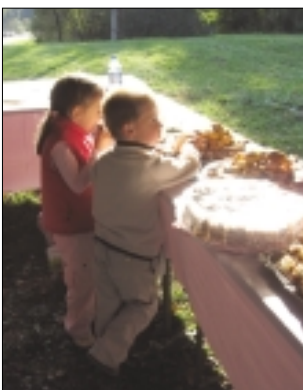
Tudi najmlajši so prišli na svoj račun