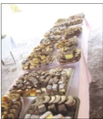
Dobrote, ki so jih pripravile domačinke