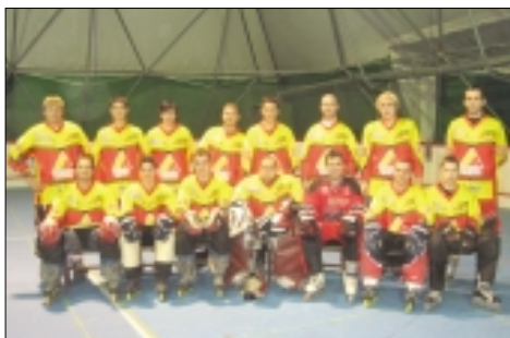
Domača ekipa RCU Prevoje brani lanski naslov prvaka

V RCU Lukovica se je peto leto zapored začela Zimska RCU liga v inline hokeju. Inline hokej je v zadnjih letih postal zelo popularen šport, zato se vedno več mladih odloča za to vrsto rekreacije. Lukovica je zaradi dobrih uspehov HK Prevoje in lepe dvorane za inline hokej postala eden od centrov tega športa v Sloveniji. V letošnji ligi nastopajo Vrhpolje, Postojna, Calcit gamsi, Grizliji, Hervis, Fitnes c. Ložar, Proletarci, Pingvin Grosuplje in RCU Prevoje. Sistem tekmovanja je dvokrožen, zato se bo odigralo 72 tekem, v mesecu februarju pa se ekipe pomerijo še v Kocijevem Memorialu. Lanski naslov prvaka brani domača ekipa RCU Prevoje. Liga je zelo medijsko