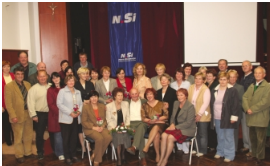
Članice Ženske zveze s simpatizerji

Članice Nove Slovenije iz Občine Lukovica smo že dalj časa ugotavljale, da so ženske v naši občini zelo aktivne v prizadevanjih za bolj kakovostno družbeno življenje. Kljub številnim zelo aktivnim društvom in skupinam imamo ženske le malo vpliva na politične in gospodarske odločitve v občini.