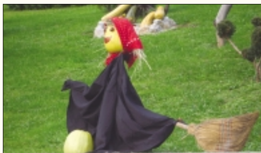
Čarovnica na metli