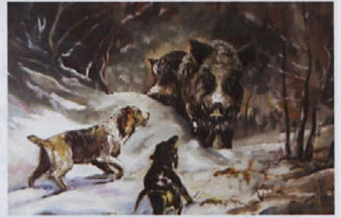
Ena izmed slik z razstave našega soobčana.

Policisti in lovci so sprejeli zavezo o skupnem boju proti nezakonitemu odlaganju odpadkov v naravnem okolju.