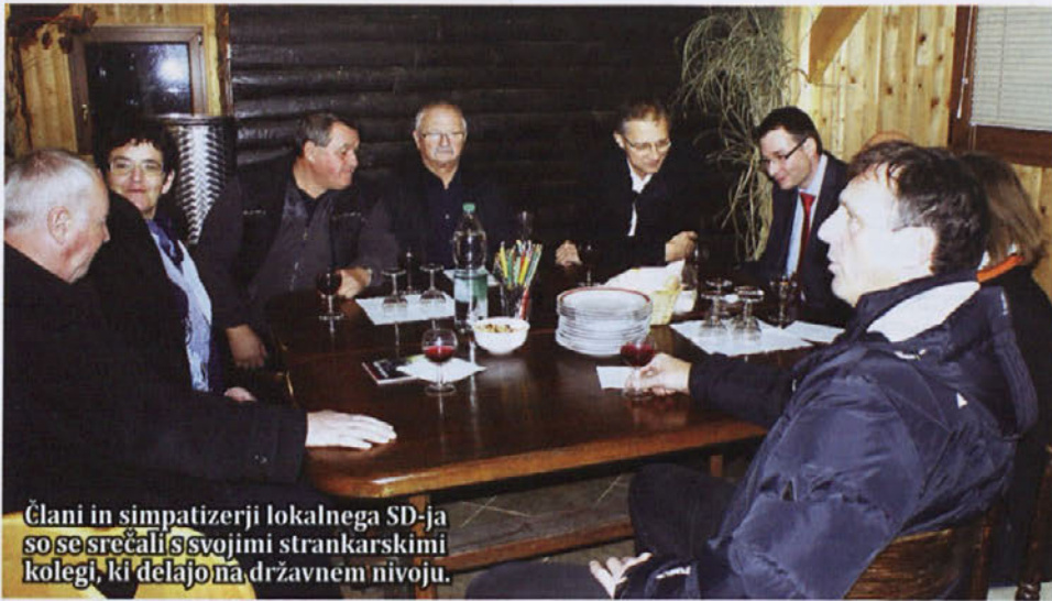
Člani in simpatizerji lokalnega SD-ja so se srečali s svojimi strankarskimi kolegi, ki delajo na državnem nivoju.