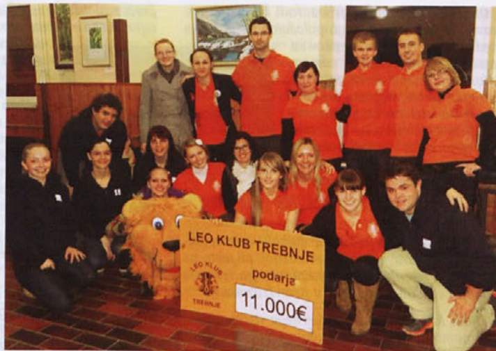
Člani Leo kluba Trebnje in P.L.I.N.-ovci so naredili še eno veliko dejanje. V le dveh dneh so za humanitarne namene zbrali preko 11.000€.