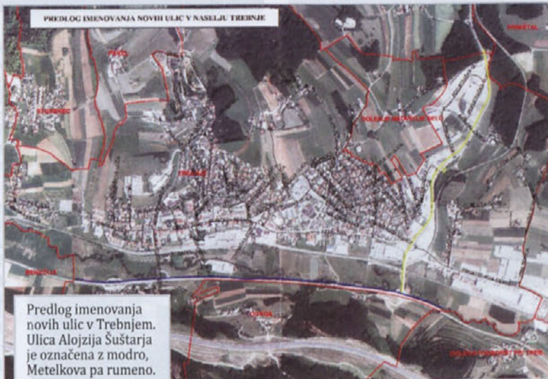
Predlog imenovanja novih ulic v Trebnjem. Ulica Alojzija Šuštarja je označena z modro, Metelkova pa rumeno.