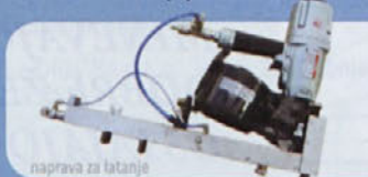
naprava za fentanje

URSA KNAUF UNIFIT 035 INSULATION do 35% popusta URSA SF 32 do 35% popusta