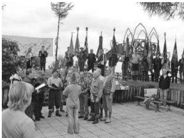
Nastop pevskega zbora LIPA

zasavskih planincev. Iz vseh koncev Slovenije so prispeli planinci, ki so sodelovali v naši akciji 100 vrhov za 100 let PD Litija. Uradni del slovesnosti so pričeli pevci moškega pevskega zbora Lipa s planin-