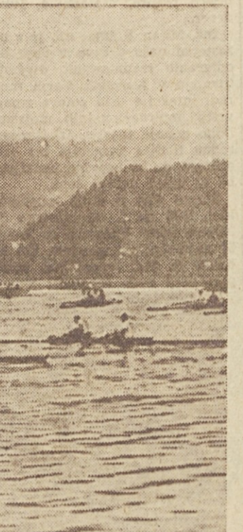
Prihodnjo nedeljo bo blejsko Jezero spet prizorišče velikih veslaških tekem

Prihodnjo sredo in četrtek, to je dne 2. in 3. avgusta bo veslaško prvenstvo Jugoslavije za tekmovalce prvega in zveznega razreda. V sredo bodo na- stopili tekmovalci prvega razreda, v četrtek pa veslači zveznega razreda. Vodstvo tekmovalja je upoštevalo iz- kušnje z nedavne mednarodne regate in je skrbilo obseg tekmovalja na sedem disciplin, ki se bodo razvijale v kratkih presledkih po 20 minut, od 16. ure dalje. Tekmovalna proga po- teka tudi sedaj s štartom v Zaki in s ciljem pred hotelom Jezero. Tekmo- vanje bo brez dvoma zanimivo, ker se bodo pomerili vrhunski veslači Ju- goslavije, Savica iz Ljubljane nastopi prvi dan prvenstva v dveh discipli- nah: double Scull in četverec s kr- marjem. Prav tako opozarjamo vse ljubitelje veslaškega športa, da bo prihodnjo nedeljo dne 6. avgusta prav tako na Bledu rekordna veslaška regata, pri kateri bodo sodelovali poleg najbo- ljših jugoslovanskih posadk tudi izbrane avstrijske in belgijske ekipe. Za to mednarodno tekmovalje je Putnik pripravil posebne vlakne z običajnim popustom; in sicer: iz Ljubljane, Ma- ribora in Zagreba. Prof. Hrovat