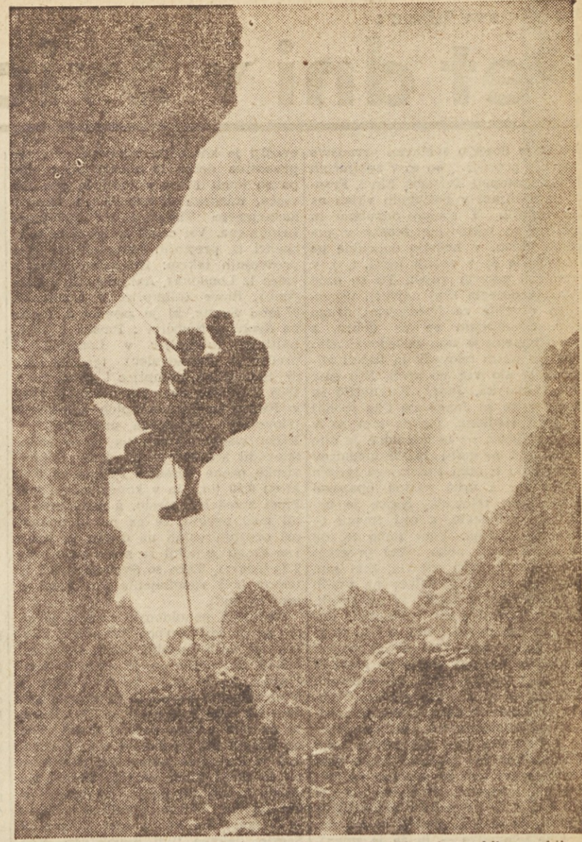
Pred kratkim je bila v Avstriji ekipa najboljših slovenskih gorskih reševalcev, ki se je spoznala z najmodernejšimi pripomočki reševalnja v planinah. Izkustva, ki jih je pridobila na tečaju v inozemstvu, že uspešno prenaša na mlade gorske reševalce

JUG : JADRAN 6:3 (4:1) Značilno za to igro je bil zlasti prvi polčas, v katerem si je Jug s precejšnjim naskokom zagotovil zmago. Tekmovaljevo bodo danes zaključeno.