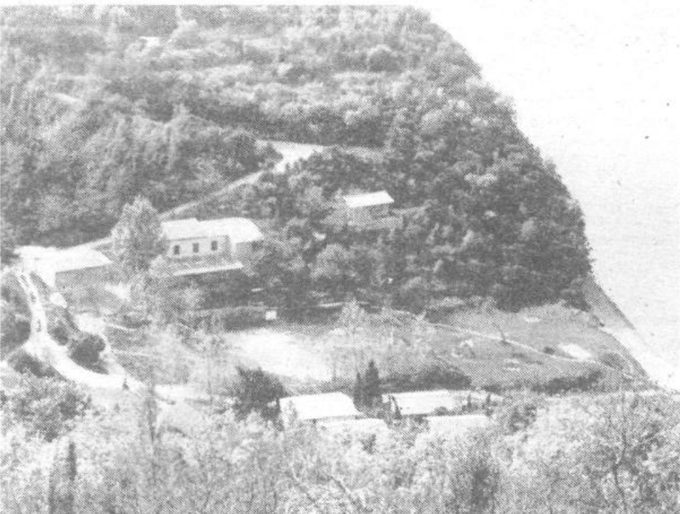
S panoramskim posnetkom ni mogoče zajeti celotnega letovišča v Pacugu. S ceste Strujan – Beli križ se ponudi takšen pogled na njegov osrednji del. Šele ob prihodu med hišice in vstopu vanje pa je mogoče videti mikavneje opremljene bivalne prostore