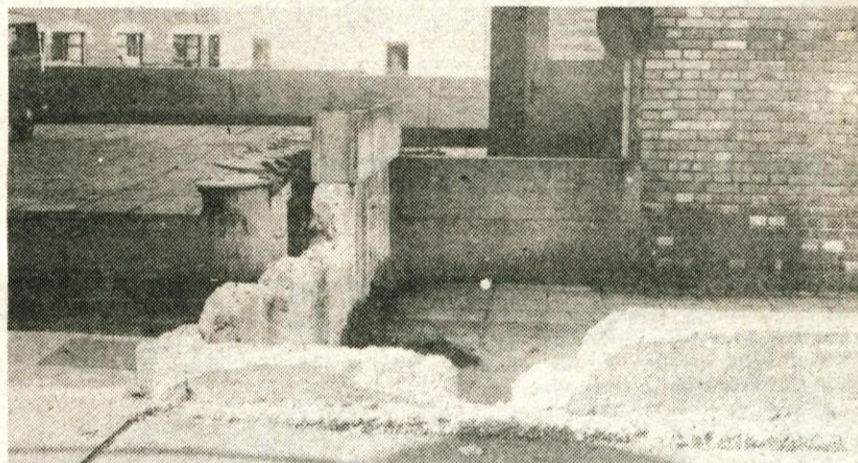
Trzič — Ob Mercatorjevi blagovnici na avtobusni postaji v Trziču je Tobak hotel postaviti svoj kiosk za prodajo časopisov. Stvar je bila že tako daleč, da je to pomlad že prišel buldožer in začel podirati zid ob blagovnici, a se je Mercator premisлил in ni dovolil gradnje, češ da gostje iz njegovega bifeja ne bi imeli razgleda skozi okno. Nb, zdaj imajo razgled — na podrtijo.