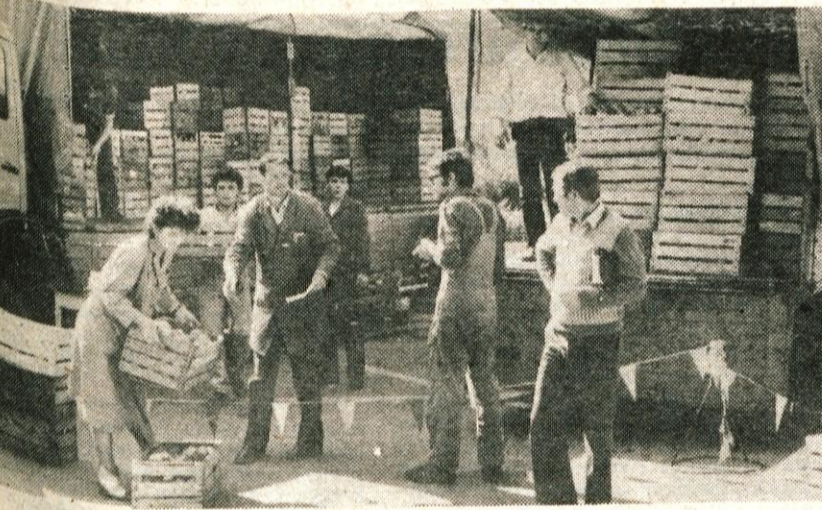
Preskrbljeni za zimo — Sezona nakupa ozimnice je na vrhuncu, seveda, če jo imamo kam shraniti in če žep prenese večji enkratni izdatek. Po prvih ocenah se bo tudi letos veliko ljudi oskrbelo z ozimnico pri sorodnikih in znanih na podeželju, večina pa je odvisna od ozimnice, za katero najpogosteje poskrbe tovarniške sindikalne organizacije. Tudi pred kranjski Tekstilindus sta v petek jabolka za ozimnico pripeljala dva tovarnjaka, ki pa sta bila kar kmalu prazna. (jk)

Ob dvajsetletnem jubileju bi festival verjetno zaslužil bolj vesela razmišljanja. Toda, če je v vseh teh letih — filmi so se enajstkrat odvrteli pred podobno prazno dvorano — šlo mimo tudi toliko neizkoriščenih priložnosti, jubilat pač ne bi smel slišati le ploskanja. L. M.