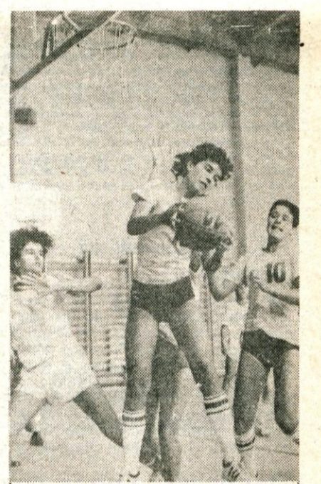
Škofja Loka, 5. oktobra — Košarkarski delavci kluba Lokainvest Odeja so bili že drugi organizatorji finalnega dela republiškega prvenstva za starejše pionirke. Za ta naslov so tekmovalce mlade košarkarice ŽKK Maribor, ID Ježica, Slovan in Lokainvest Odeja. Naslov so spet osvojile košarkarice ŽKK Maribora, ki so v boju za prvo mesto premagale domačinke, Lokainvest Odejo. Izidi so bili naslednji — Lokainvest Odeja : Slovan 48:47, ID Ježica : Maribor 47:49, ID Ježica : Slovan 58:48, Lokainvest Odeja : Maribor 35:57. -dh) — Foto: F. Perdan

Za ameriškega naročnika bodo delali do februarja. H. J.