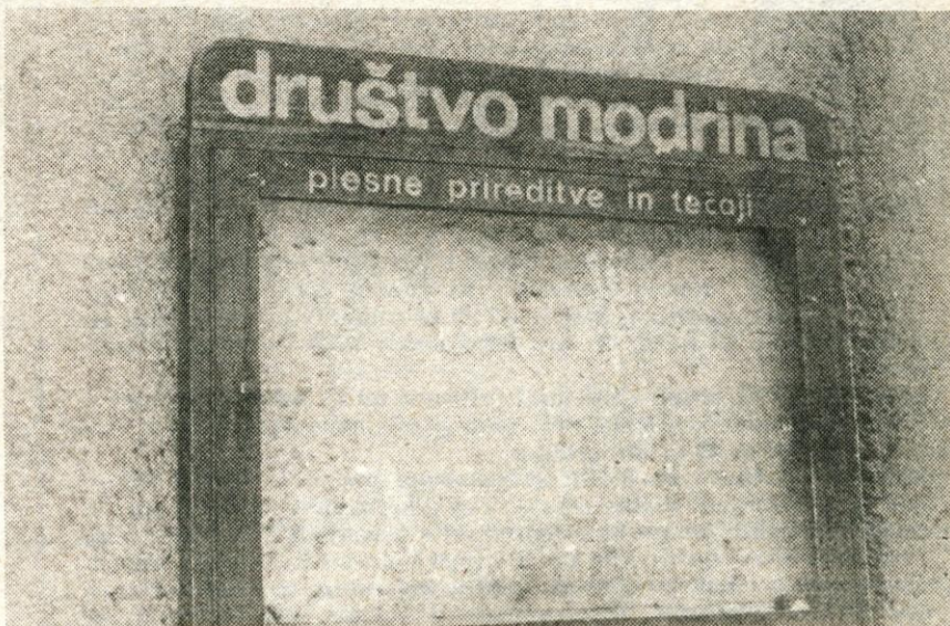
Kranj, oktobra — Kakšno reklamo dela in komu že dolga leta?