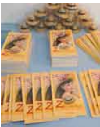
Na razstavi bodo našle mesto tudi vse publikacije, povezane s slavninarstvom.

Drugi del razstave smo trenutno poimenovali OD SLAME DO KITE. V osrednjem delu bo seveda snop pšenice, zbirka različnih vzorcev in tehnik pletenja kit, v kateri bo omogočeno tudi praktično spoznavanje pletenja, pozabili pa nismo niti na pletenje kot družaben dogodek, navodila za vzgojo pšenice za slavninike, kitarje ter predmete, ki so neobhodno potrebni. Ob tem naj bi si obiskovalci ogledali tudi filme od pšenice do slame, pripravili bomo zvočni posnetek pripovedovanja ter