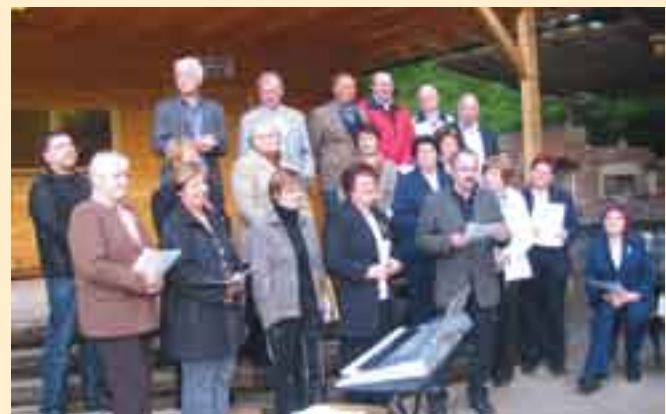
VEČER LJUDSKIH PESMI POD KOZOLCEM v četrtek, 19. maja 2011, ob 19. uri, na prireditvenem prostoru v Turnšah. Dobrodošli!