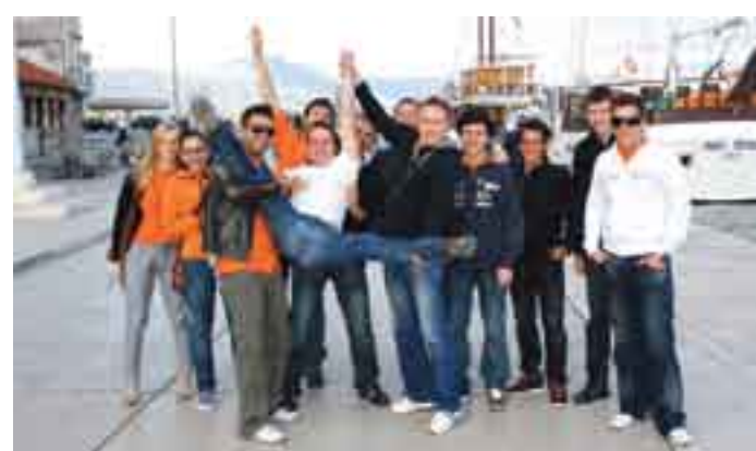
Godbenice in godbeniki na sproščenem ogledu Trogirja.