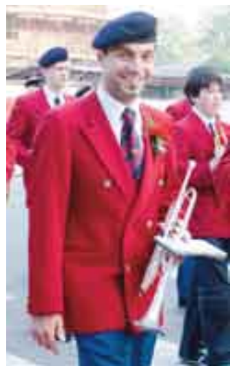
Tipičen primer zadovoljnega a poročenega godbenika.

grjane (1893–1991) s Slovenijo. Od leta 1932, ko je prvič obiskala Ljubljano, do leta 1940 je Slovenijo redno obiskovala in se družila z intelektualci, s katerimi je ohranila prijateljsko razmerje vse svoje dolgo življenje. Bralec se bo seznanil s težko dostopnimi arhivskimi gradivi: pismi, fotografijami, dokumenti in dejstvi o bolgarski pesnici in kulturni situaciji iz tiste-