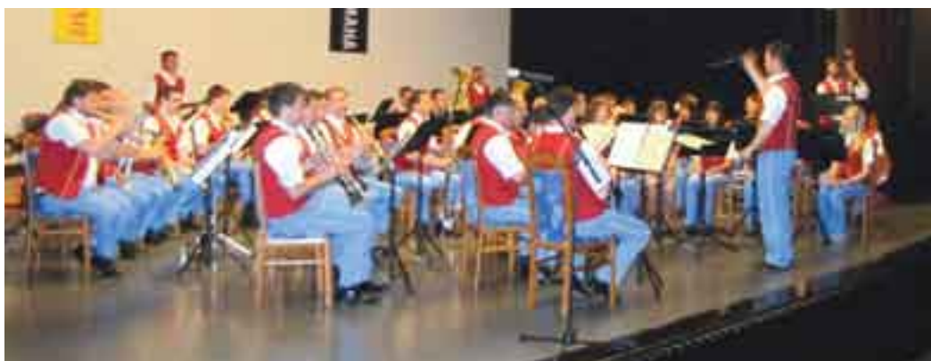
Na tekmovalnem odru.

Godba Domžale se je od 14. do 17. aprila mudila v Splitu na Hrvaškem, kjer se je udeležila mednarodnega tekmovanja godb in pihalnih orkestror iz Hrvaške, Slovenije (ti so bili najštevilnejši) in Avstrije. Tekmovanje, katerega uradni naziv je Mitteleuropa Blasmusikfestival 2011, naj bi bilo pravzaprav festival pihalnih orkestror, katerega cilj je po navedbah organizatorjev popularizacija tovrstne glasbe, razvoj medsebojnega sodelovanja pihalnih orkestror