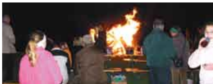
Prvomajsko kresovanje ŠRD Konfin – Sv. Trojica