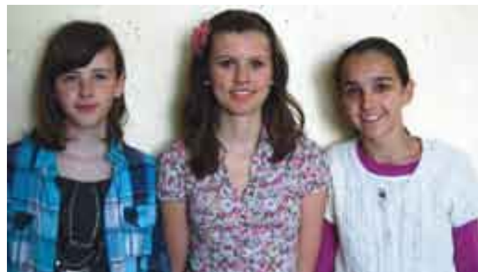
Avtorice zanimive raziskave o slovenskem narodnem izročilu v ZDA.

Predvidevamo lahko, da so nam izpolnjene anketne vprašalnike vračali predvsem tisti slovenski izseljenci in potomci slovenskih izseljencev, ki so najbolj ponosni na svoje slovenske korenine. Edi-