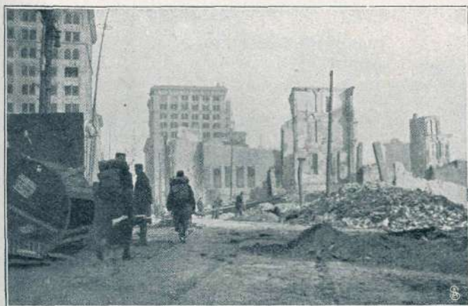
Razvaline San Francisca.

Princ Konrad Hohenlohe (str. 384). Hitro se suče kolo politike. Komaj smo dobili sliko Gautschevega naslednika tržaškega namestnika princa Hohenlohe, je že odstopil. Sprejel je nalogo, da izvede v Avstriji splošno in enako volilno pravico, to težavno vprašanje, ki je vrglo že njegovega prednika. Nastopil je odločno zanj, kot mož demokratskega mišljenja. A padel je zaradi tega, ker ni mogel držati zbornici dane besede, da bo varoval korist Avstrije proti Ogrski. Odstopil je, a pride skoraj gotovo zopet kmalu nazaj.