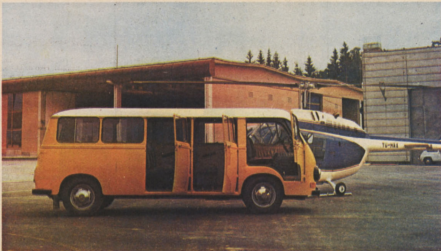
Vozilo, na katerega čakajo mnogi: naš novi minibus