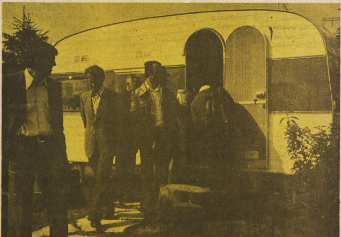
Na letošnjem Zagrebškem velesejmu so bile pred našimi prikolicami vrste – dokaz več, kako narašča zanimanje za naše izdelke doma kot po svetu.