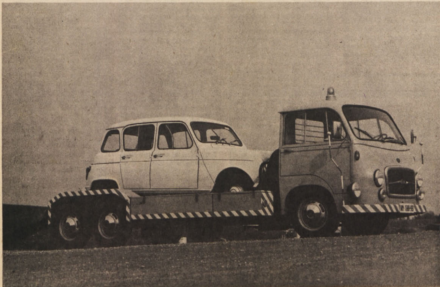
Intervencijski avtomobil za vlečno službo si znova utira pot na jugoslovanske ceste