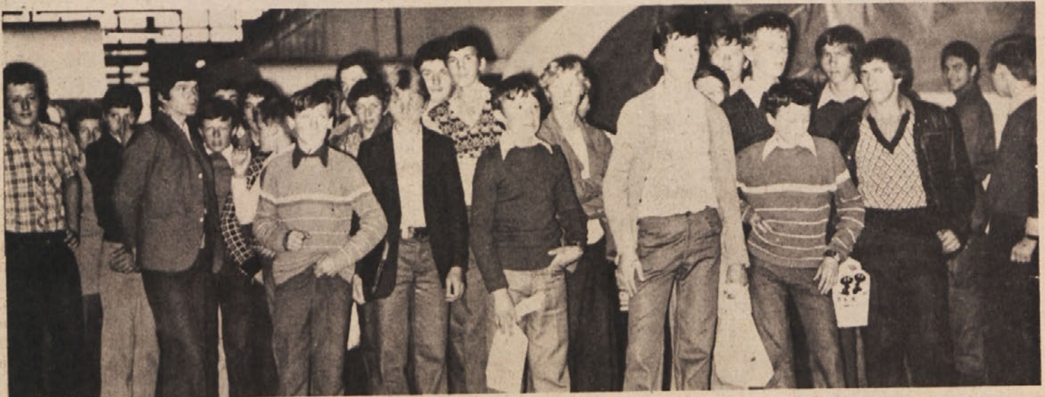
Na mladih svet stoji – je star slovenski pregovor, ki ga cenimo tudi v naši delovni organizaciji. Vsako leto sprejmemo več kakor sto mladih, ki se želijo izučiti poklica