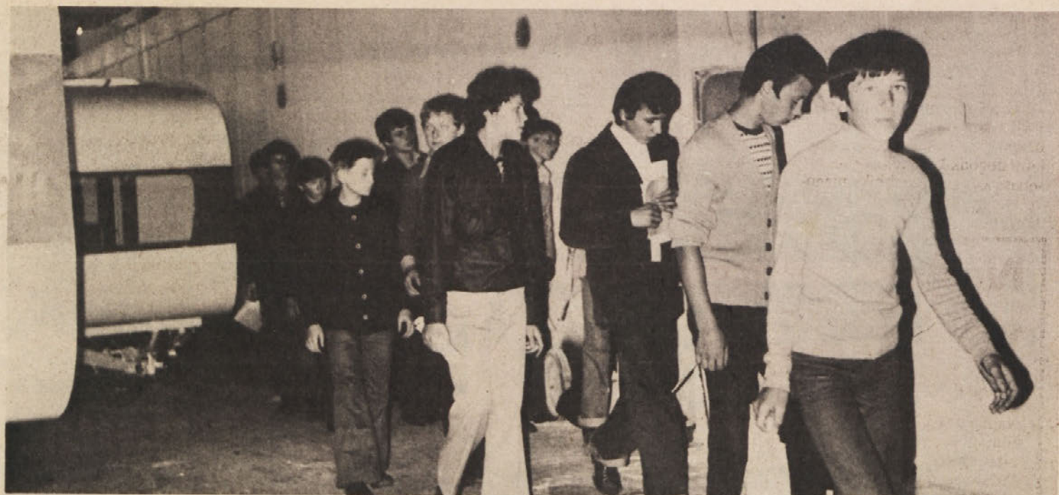
Bodoči učenci v gospodarstvu pri spoznavanju delovnega okolja v eni izmed proizvodnih dvoran IMV