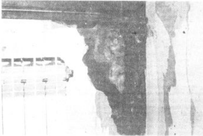
Takole izgleda stena pod teraso. Hiša je bila zgrajena leta 1975