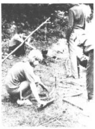
Postavitve zvezdnega ognja