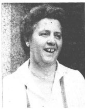
„Še malo in odšla bom v zaslužni pokoj“

„Delo točajke v gostinskem lokalu je sila naporno. Delo z ljudmi ni hvalično, delovni pogoji slabi, poleti vročina, tla hladna. „Ravno prav, da se „naležeš revme.“ Zasluzek je bolj skromen. „Kamorkoli greš, nikjer ni boljše, le da povedo ne.“ Malo se nasmehne, se obrne h gostu, ki je pravkar vstopil in vljudno vpraša: „Ali že dobite? Kaj pa želite?“