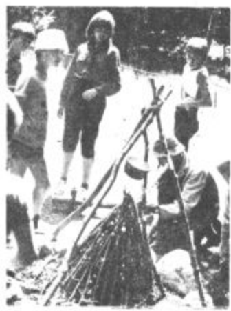
Ognjišče, kjer je kmalu zagorel čaj, v kotelku pa se je skuhal čaj —