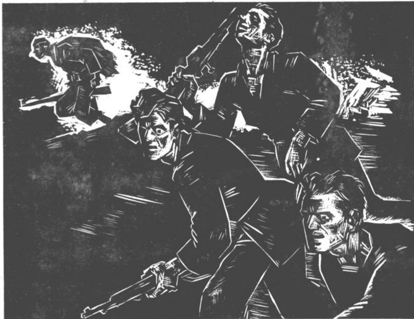
Borili smo se, krvaveli (linorez — Nikolaj Pirnat)

Za 22. julij — praznik vstaje slovenskega naroda iskreno čestitajo vsem borcem NOV in aktivistom