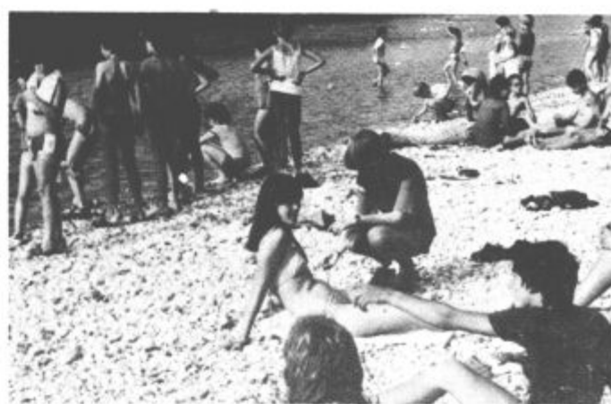
Po kosilu se prileže sončenje ob Savi.

Zadnji večer je bila na vrsti taborniška poroka. Zanimiva je bila predvsem zaradi množičnosti. Poročilo se je kar 10 parov. Toliko se jih ni verjetno v vsej zgodovini odreda Jezerski zmaj. Matičar je imel veliko