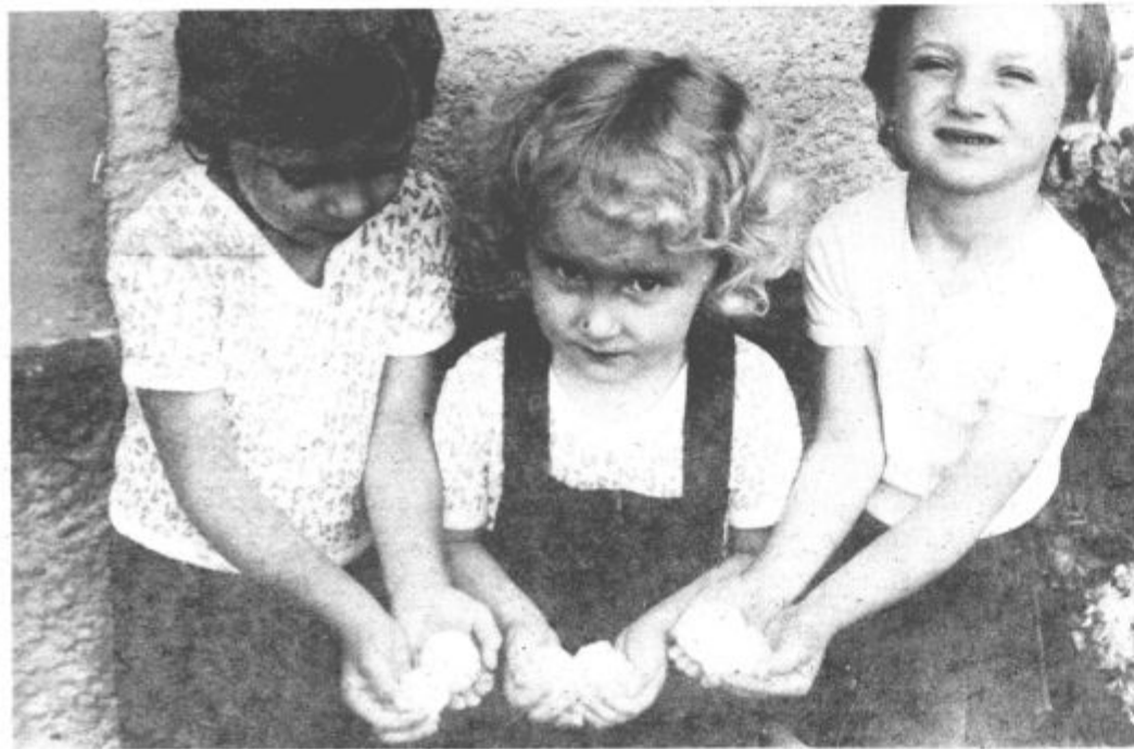
Ko je strah po neurju minil, so bile »kepice« primerne tudi za igro

Gornjo Savinjsko dolino je v nedeljo popoldne zajelo neurje s točo, kakršne ne pomnijo tudi najstarejši prebivalci, saj ni bilo malo primerkov velikih kot kurje jajce. Neurje je prizadelo predvsem levi breg Savinje, njegova moč pa se je stopnjevala od Radmirja, preko