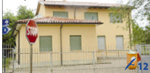
Nekdanjo šolo na Plešivem bo upravljala center Emil Komel