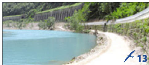
Obsoška kolesarska steza, ki to še ni, že privablja obiskovalce