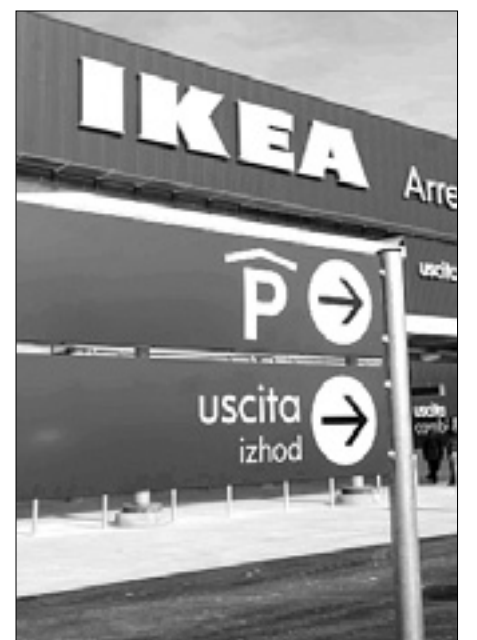
Ikea pri Vilešu

»Realizacija velikega komercialnega centra, kot je Ikea v Vilešu, zahteva tudi od upraviteljev zelo veliko truda. Birokratski postopek za izgradnjo veletrgovine je bil uspešno izpeljan po zaslugi sodelovanja med podjetjem, deželo Furlanijo-Juljsko krajino in občino Vileš,« je zaključil Luca Ciriani. (Ale)