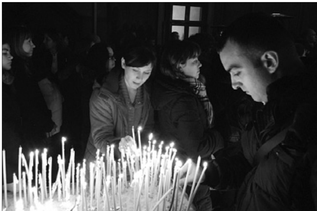
Za srbsko-pravoslavne vernike je danes božična vigilijska (na sliki posnetek z lanskega praznovanja) KROMA

Srbsko-pravoslavna skupnost: danes badnja, jutri slovesno praznovanje božiča - Grško-pravoslavna skupnost obhaja danes praznik Kristusovega razglašenja z blagoslovom voda