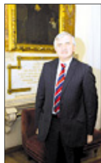
Obisk pri predstavnih srbsko-pravoslavne skupnosti v Trstu, ki se zanimajo za zaščitni zakon