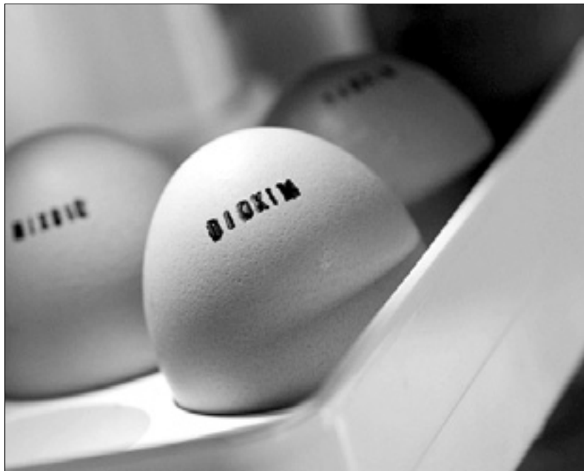
Z dioksinom okužena kokošja jajca

Zastrupljenih do 150 tisoč ton krme - Preplah po državi, prizadetih več kot tisoč kmetij - V Sloveniji vse pod kontrolo