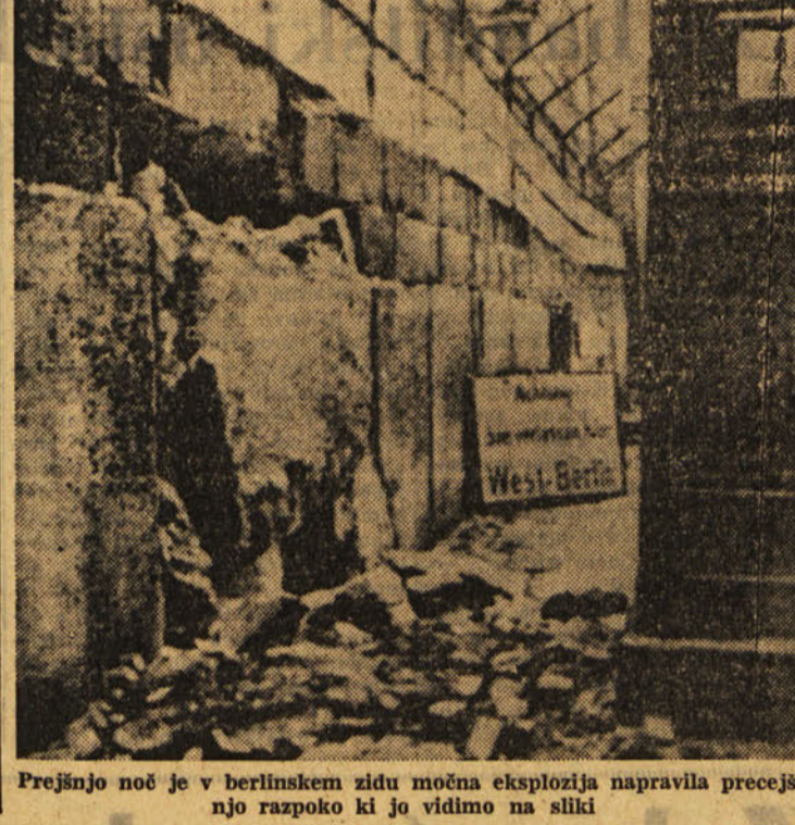
Prejšnjo noč je v berlinskem zidu močna eksplozija napravila precejšnjo razpoko ki je vidimo na sliki

Adenauer predlaga socialdemokratom »veliko koalicio« brez liberalcev Danes bo imel kancler prvi razgovor s predstavniki socialdemokratske stranke, zatem pa s predstavniki liberalcev - Socialdemokrati »resno upoštevajo« predlog - De Gaulle pride januarja v Bonn