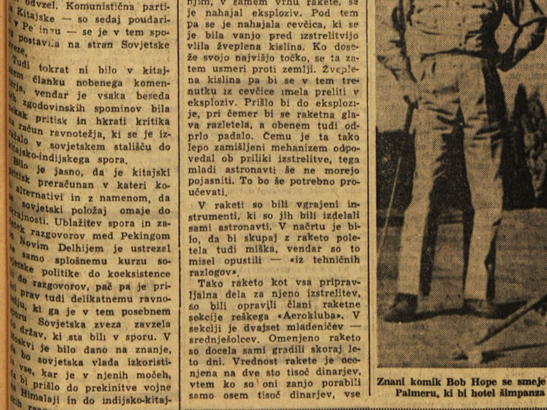
Znani komik Bob Hope se smeje amerškemu prvaku v golfu Arnoldu Palmeru, ki bi hotel šimpanza Charlija naučiti, kako se igra golf

OVEN (od 21.3 do 20.4.) Neka vija odločitve bi utegnila imeti zelo važne posledice. Ne dovolite, da bi vas obvladala jeza. Nervoznost. BIK (od 21.4. do 20.5.) Skušajte že v teku jutra opraviti vse najvažnejše posle. Neka novost vam ne bo mogla preprečiti uresničitev važnega načrta. Zdravje dobro. DVOJKA (od 21.5. do 22.6.) Ne sprejmite novih finančnih obveznosti in ne spreminjajte svojih programov. Imejte več zaupanja vase. Zdravje zadovoljivo. RAK (od 23.6. do 22.7.) Ogibajte se novih odgovornosti. Bodite bolj razumevni do občutljivih oseb. Zdravje nespremenjeno. LEV (od 23.7. do 22.8.) Dan je velik uspeh za tujce. Srečne ure