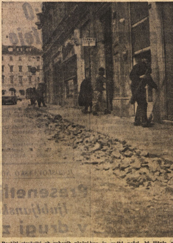
Razbiti strešniki ob robovih pločnikov in redki pešci, ki iščejo ob zidovih zaščite pred strditimi sunki burje