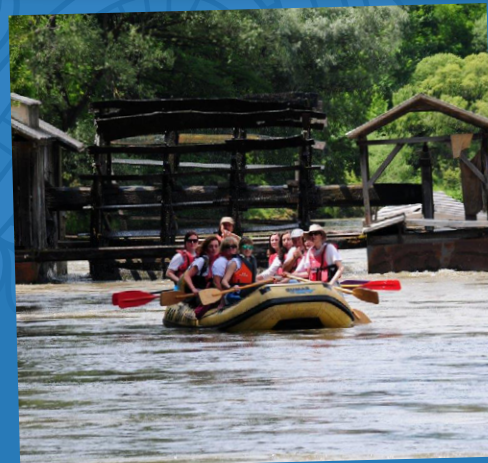
Raziskovalni spust po Muri