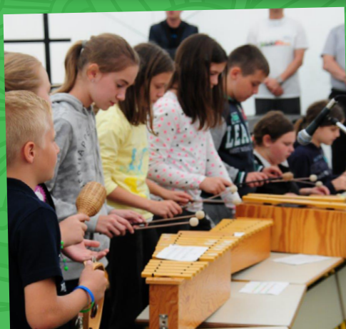
Učenci Osnovne šole Veržej so poskrbeli za bogat kulturni program