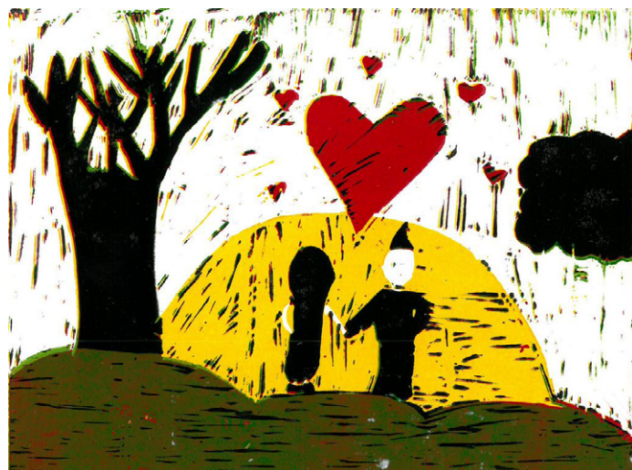
Odpustniki sporočajo (avtorica risbice Zala G.)