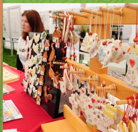
Predstavitvene stojnice društev in organizacij