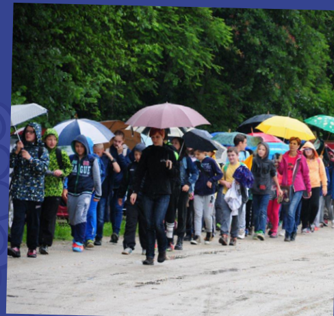
Zjutraj, še v dežju, so pričeli prihajati prvi obiskovalci