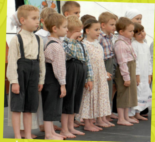
Čudovit kulturni program so pripravili učenci vrta Veržej