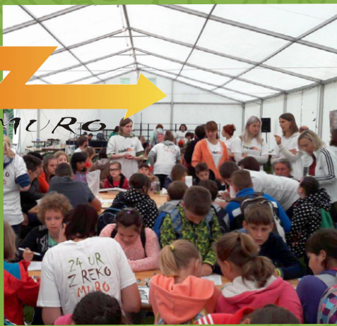
24 ur z reko Muro se je pričelo

Izobraževalni in doživljski dogodek je potekal 10. in 11. junija 2016.