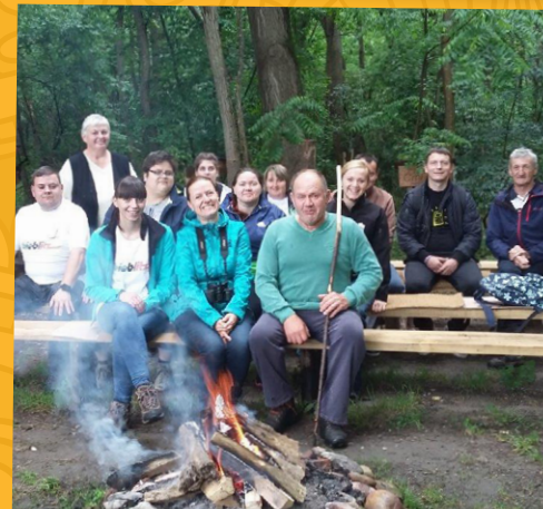
Ob Muri se je prilegla tudi buraška južina