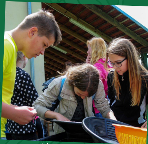
Iskanje zlata v Muri