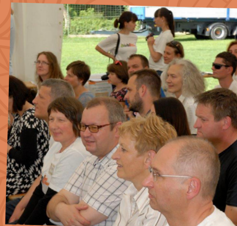
Osrednjega dogodka se je udeležila tudi Irena Majcen, Ministrica za okolje in prostor