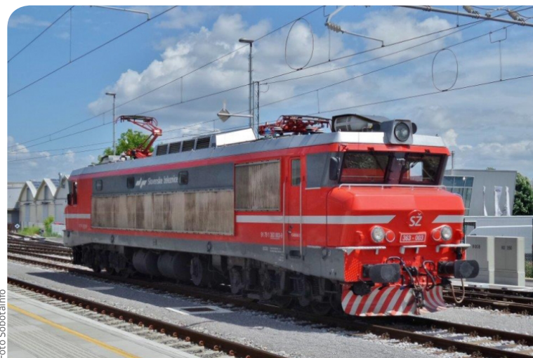
Prihod prve električne lokomotive v Mursko Sobotu