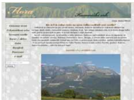
Predstavitve proučevanega območja na spletni strani.

Kamniški vrh, 1.259 m visok hrib na južni strani Kamniških Alp, je priljubljen rekreativni cilj mnogih Kamničanov in drugih ljubiteljev narave. Med sprehodi nanj sem fotografirala mnogo različnega cvetja, nato pa doma ugotavljala imena rastlin. Ni bilo lahko, saj sem imela le malo literature, na spletu pa je bilo informacij o našem rastlinstvu premalo, še posebno slik, po katerih bi bilo mogoče določiti vrste.