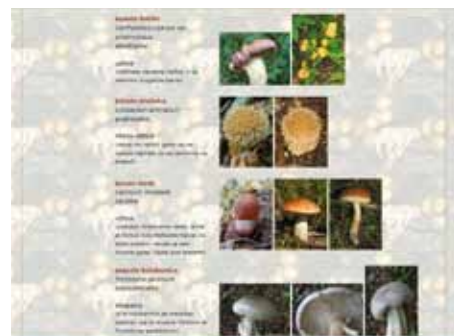
Spletna stran vabi na ogled tudi ljubitelje gob.