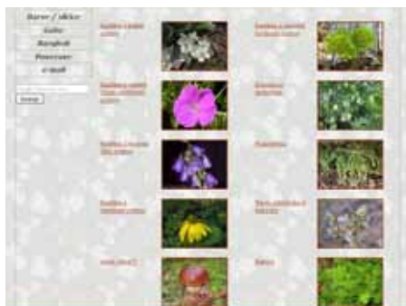
Možnost iskanja rastlin po barvi cvetov.

Obiskovalec spletne strani lahko išče rastline po abecednih seznamih slovenskih in znanstvenih imen ter po družinah, za hitrejše iskanje lahko najde vsako rastlino tudi po sličicah glede na barvo cvetov, v posebnih rubrikah pa so lesnate rastline, trave, mahovi, praprotnice in glive. Tako lažje najdejo imena in opise rastlin tudi tisti, ki ne poznajo imena vrste ali družine.