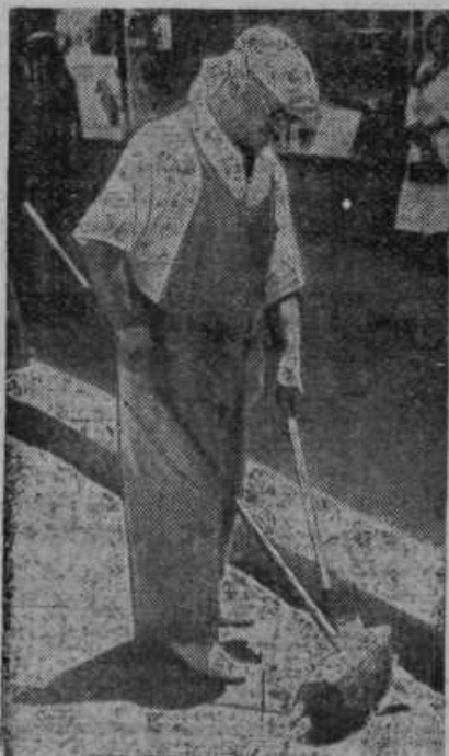
63 letni jud je gradil dolga leta kot inženir mostove v Nemčiji, sedaj pa je kot izgnanec cestni pometač v Palestini

Sv. Vid pri Ptuj. Fantovski odsek in dekliški krožek priredita v nedeljo, 23. julija, mladinski dan s pestrim celodnevним sporedom. To bo prva prireditev slovenske katoliške mladine v Sv. Vi-