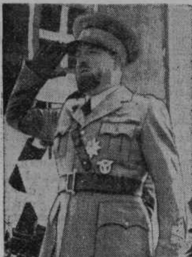
Gino Grandi, novi italijanski pravosodni minister, ki je bil nekaj let poslanik v Londonu

du in v Halozah sploh. Zato obe imenovani društvi, ki vršita ob robu slovenskih Haloz v najtežjih razmerah svoje velepomembno poslanstvo, vabita na to svojo prvo prireditev vae prijatelje katoliške mladine in slovenskih Haloz. Posebno