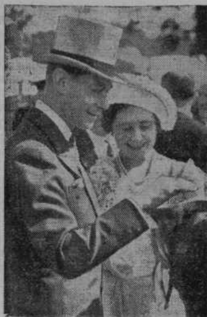
Bivši albanski kralj Zogu je zapustil Bukarešto in se je podal v London s svojo mlado soprogo Geraldino

toplo pa so vabljeni vsi fantovski odseki in dekliški krožki ptujskega okrožja in Dravskega polja, da tega dne prihite s svojim članstvom k nam, da bomo tako tu v Sv. Vidu, v tej nekoči močni nemčursko-liberalni trdnjavi skupno manifestirali zvestobo našim vzvišenim načelom: Bogu, Cerkvi, sladki slovenski materini besedi, mlademu vladarju Petru II. in veliki domovini Jugoslaviji. Vsem ključemo: v nedeljo, 23. julija na veselo svidenje v Sv. Vidu!