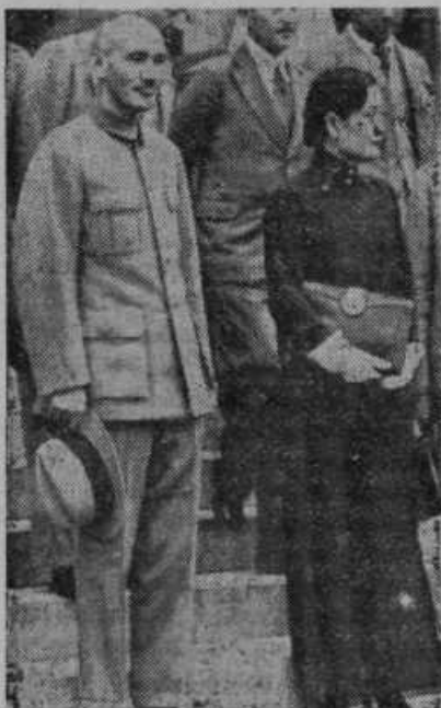
Kitajski general Cangkajšek s svojo soprogo. Maršal je izdal ob dveletnici izbruha japonsko-kitajske vojne proglas, v katerem poziva svoj narod na odpor napram Japoncem do zmagave Kitajcev