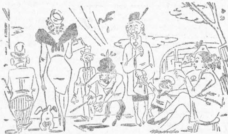
— Ah, pogledite, pomlad prihaja!