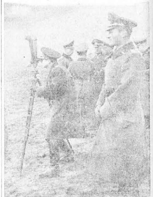
pregledujejo fronto na Zapadu, kjer so Nemci prekoračili Maginotovo linijo