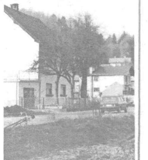
Notranje Gorice: Kdaj boljša voda in varnejše ceste?