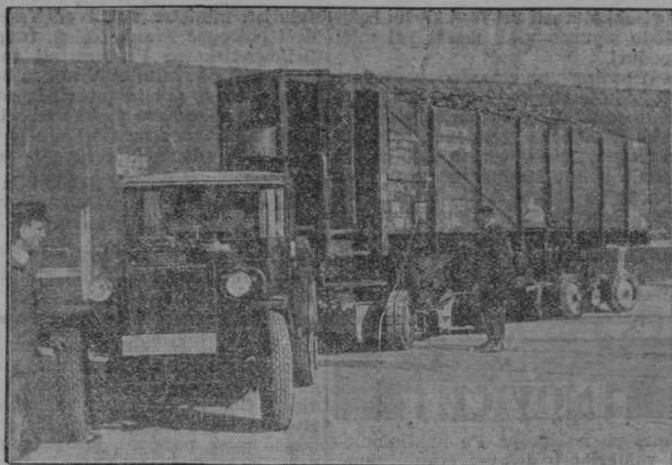
Nemške železnice spravljajo naložene železniške vagonne na avtomobilskih podstavkih po navadnih cestah na naslov naročnikov.