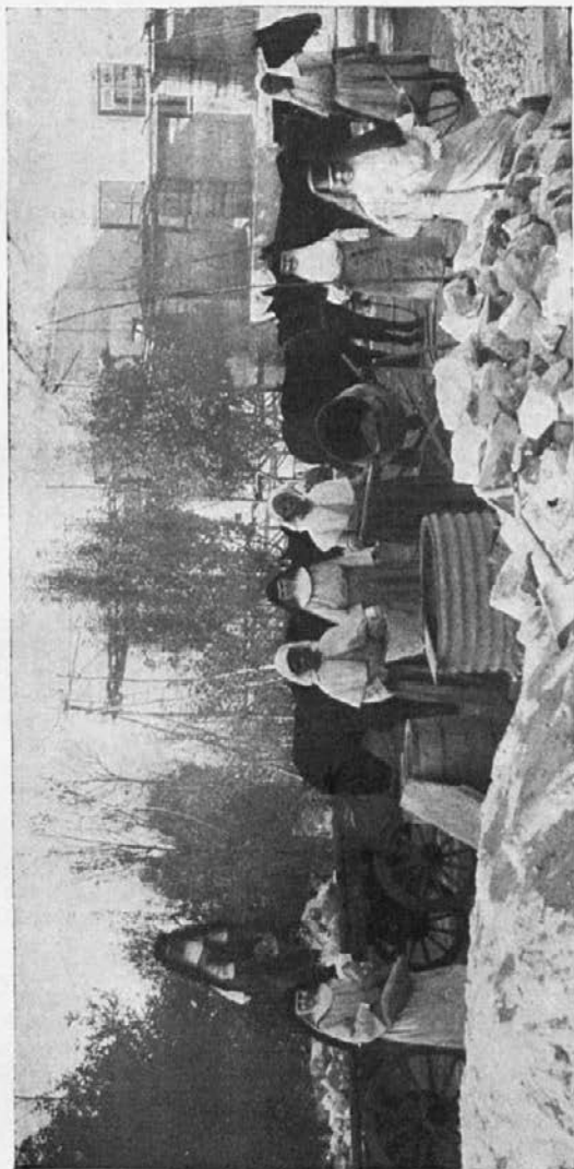
Črne in bele sestre pomagajo pri zidanju misijonske šole.

Seveda, izven šole pa nam mora pomagati tudi pri vseh drugih hišnih delih — in tudi pri zidanju, kot to vidite