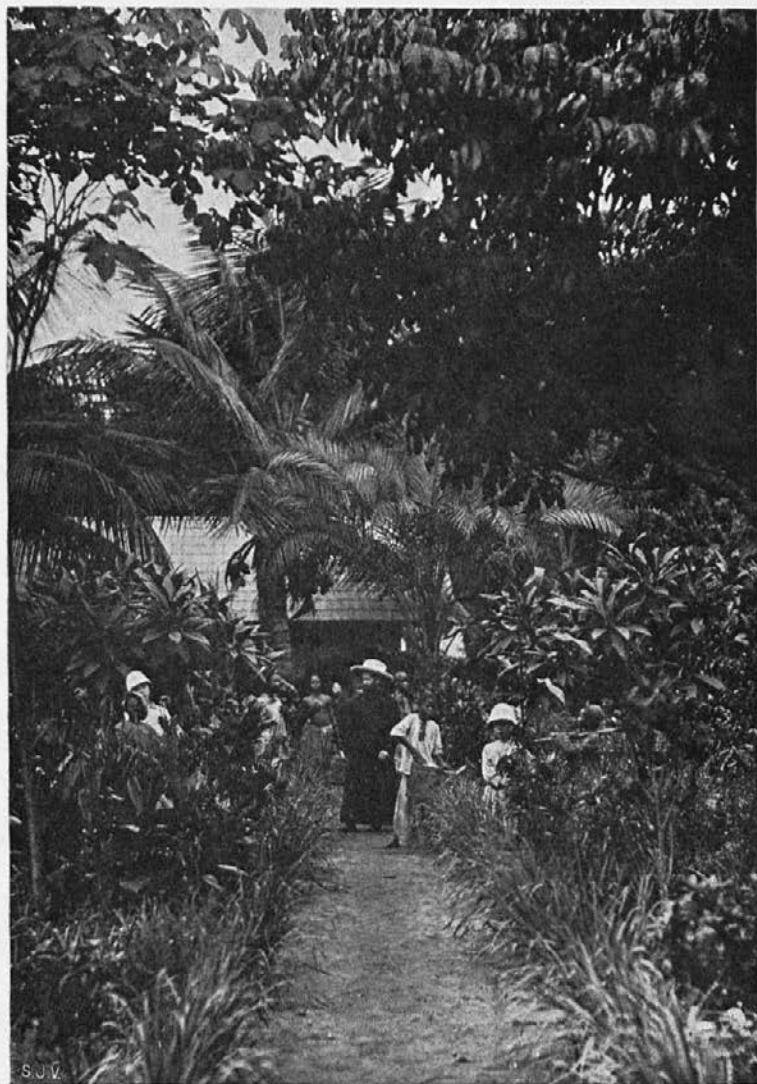
Palmov gaj v Kongu.

ustanovili eno novo postajo, prejšnje pa prav dobro uspevajo. Prav lepo uspeva delo usmiljenih sester: šole, delavnice, lekarne za reveže, otroški vrtci i. t. d. in imamo