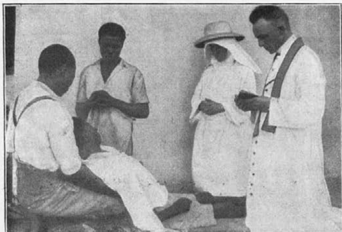
Misijonar deli umirajočemu zadnjo tolažbo.