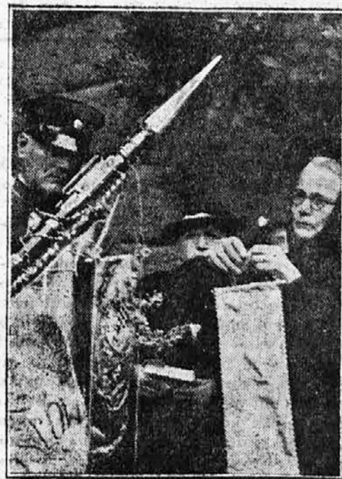
Mati padlega dobrovoljca pripenja trak na prapor dobrovoljcev ob priliki razvitja prapora dne 28. junija 1936.

Naš narod ne bo mogel nikdar odtehtati njih žrtev. Vendar pa jim je visoko odlikovanje priznanje in zagotovilo, da so njihove rane, zasekane v materinska srca, nam vsem nadvse svete in da je naše spoštovanje do njih prav tako globoko, kot nam je svetel spomin na njihove padle sinove, naše jugoslovenske dobrovoljce.