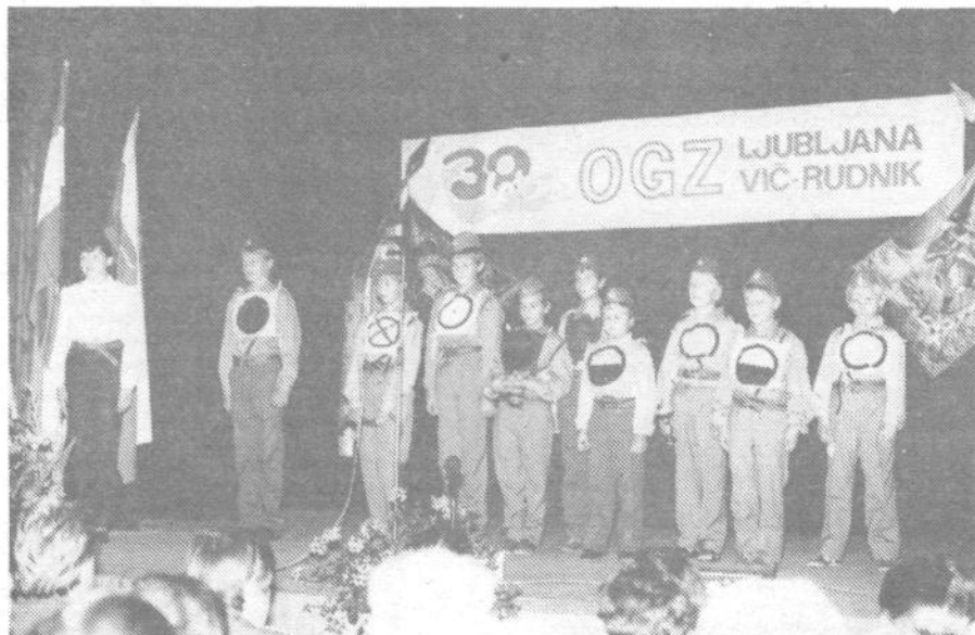
Ko smo opazovali iskren nastop mladih iskovarskih gasilcev, smo si želeli: da bi vsi ti fantje in dekleta tudi čez deset, petnajst let tako strumno stali v gasilski enoti in opravljali naloge, o katerih so odločno pripovedovali